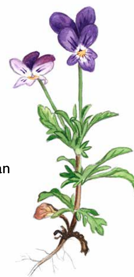
Axveronika Veronica spicata

Styvmorsviolen är en av många växter som pryder de ljusöppna hällarna runt Hjässan tidigt på våren. Klippängarna besöks av bin och andra insekter i jakt på nektar att äta.