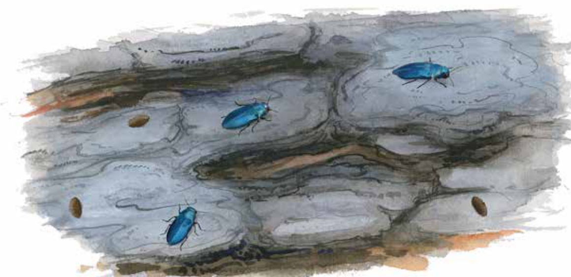
Blå praktbagge (ca 10 mm) Phaenops cyaneus

Den blå praktbaggen lägger sina ägg under barken på nyligen döda tallar och söker sig gärna till branddödade tallar.