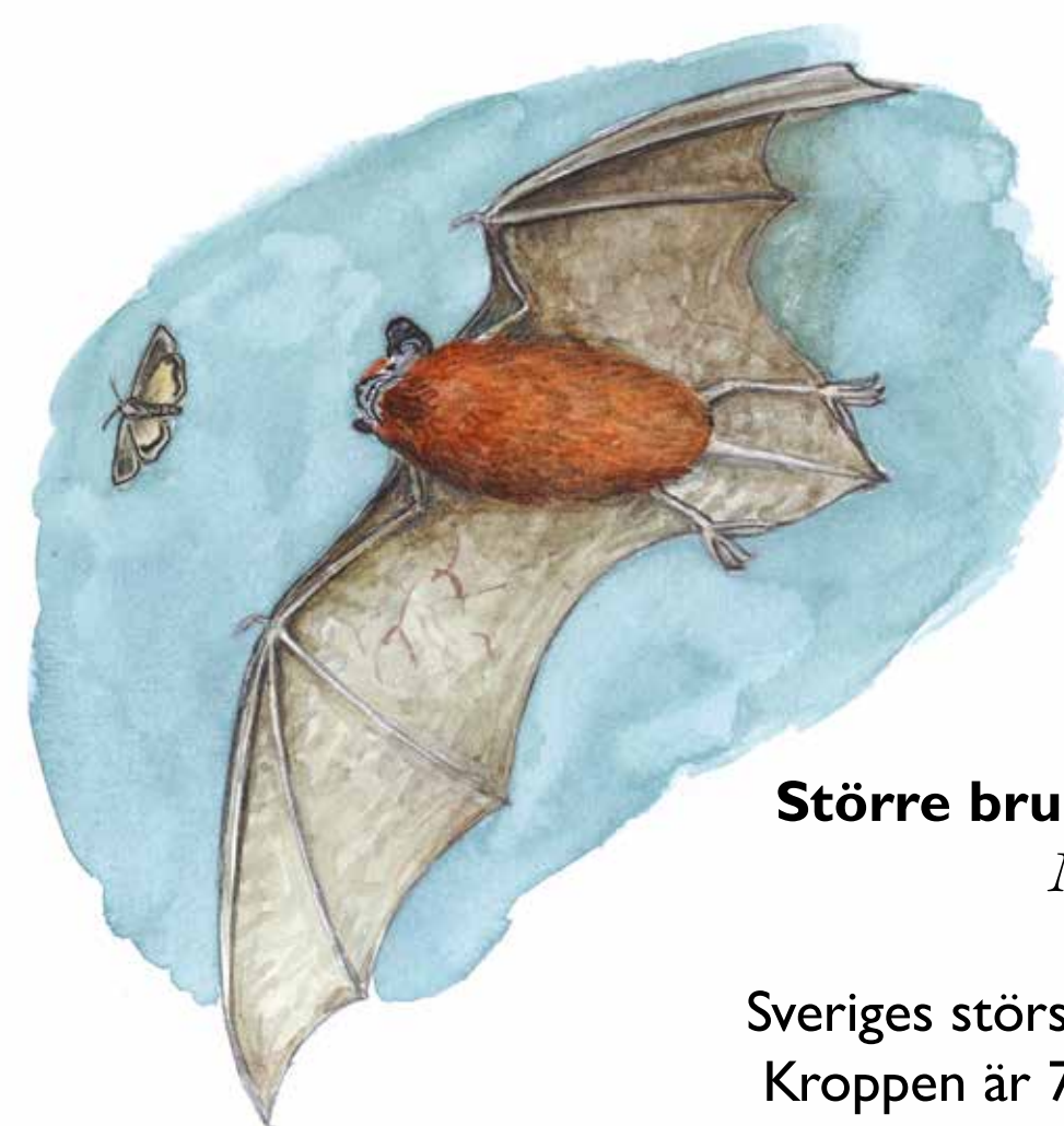
Större brunfladdermus Nyctalus noctula

Sveriges största fladdermus. Kroppen är 7–8 cm. Mellan vingspetsarna mäter den 30–45 cm.