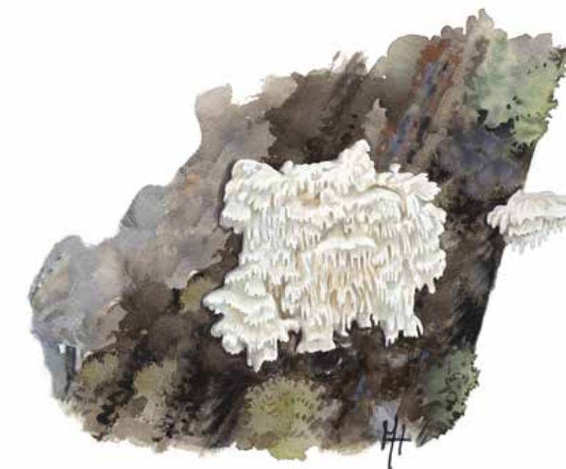
Vintertagging Irpicodon pendulus

Vintertagging växer bara på döda eller döende tallar, ofta mer än 250 år gamla.