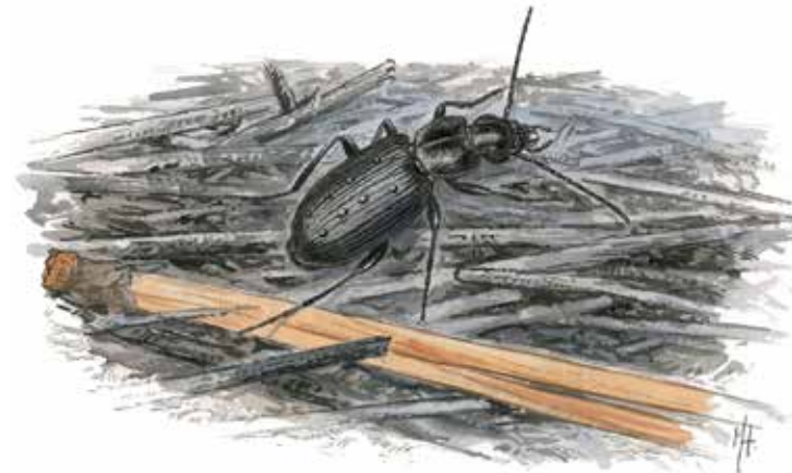
Liten brandlöpare (ca 5 mm) Sericoda quadripunctata

Den blå praktbaggen lägger sina ägg under barken på nyligen döda tallar och söker sig gärna till branddödade tallar.