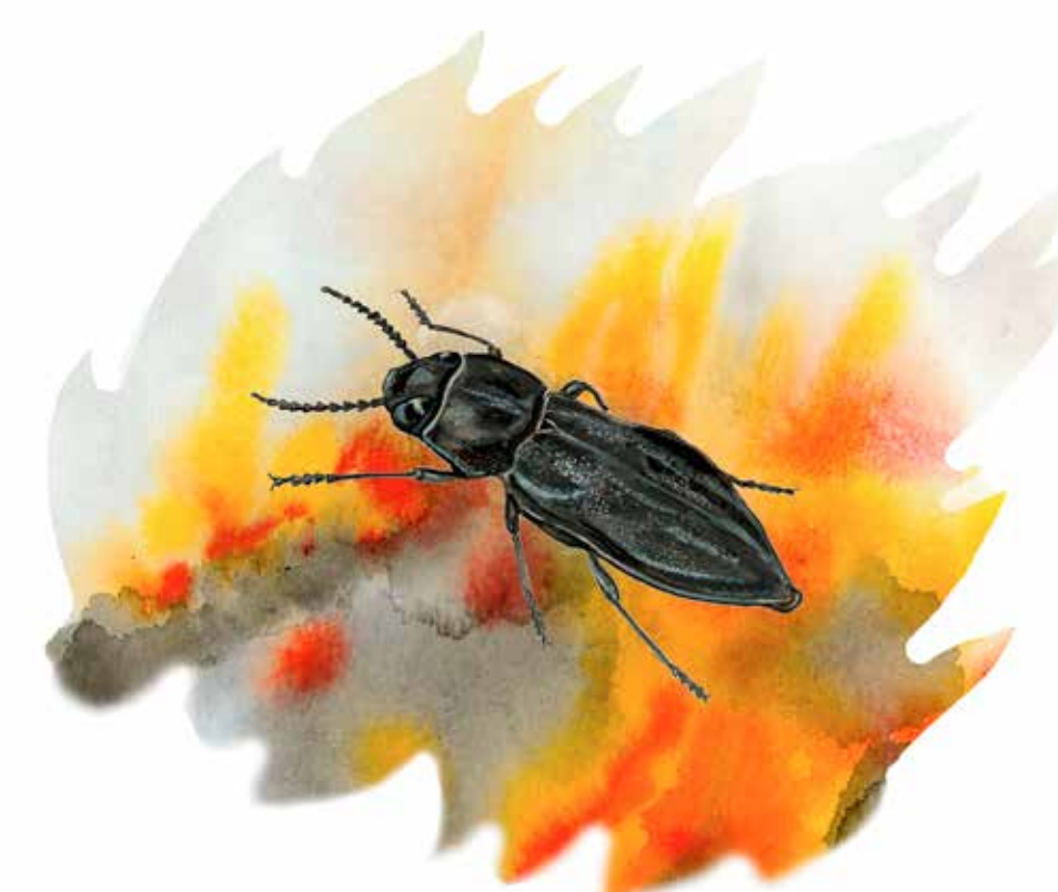
Sotpraktbagge (ca 12 mm) Melanophila acuminata

Liten brandlöpare dyker upp på bränd jord där det finns gott om bytesdjur.