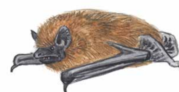
Dvärgpipistrell Pipistrellus pygmaeus

En av de lite mer ovanliga arter som påträffats i Ryssbergen.