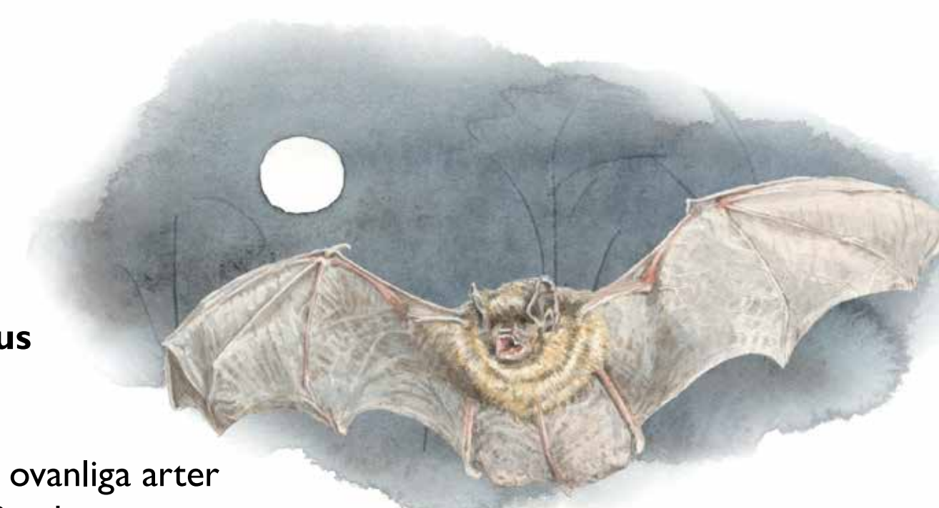
Nordfladdermus Eptesicus nilssonii

Sveriges största fladdermus. Kroppen är 7–8 cm. Mellan vingspetsarna mäter den 30–45 cm.