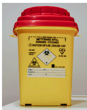
Behållare för smittförande avfall.