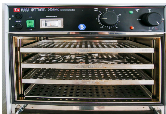
Sterilisator för redskap.

Bilder från Medicinsk fotvård i Nacka Forum.