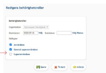
Två av tre rolltyper valda för en användare