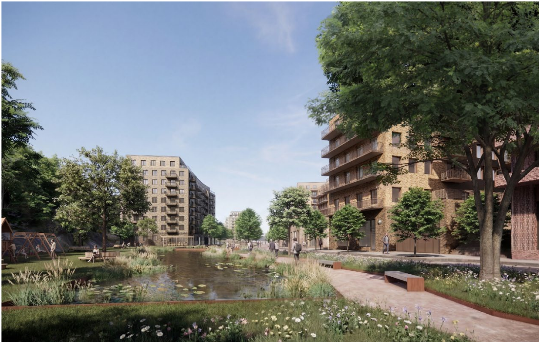
Vy av den föreslagna parken vid Hästhalmssundet.

av de ingående kvarteren och allmänna platserna. Avseende bebyggelsen finns i nuläget inga detaljerade planbestämmelser avseende fasadmateriell, balkongers gestaltning, färgsättning och dylikt, och kommunen avser att reglera detta till detaljplanens granskningskede. Planförslaget redovisar volymer och möjliga utformningar av fasader, balkonger och bostadsgårdar, men utan att reglera att byggnaderna faktiskt utformas så som illustreras.