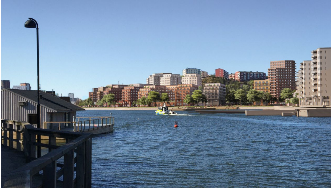
Vy mot föreslagna nya bostadshus från strandpromenaden vid Marinstaden. Bild: Kjellander Sjöberg

Detaljplanen syftar till att möjliggöra nya bostäder, service och förskolor, samt kommunala allmänna platser i form av strandpromenad runt Svindersviken, gator, parker, torg, kaj och badplats. Detaljplanen ska även möjliggöra nya allmänna kopplingar och stråk, däribland en bro över Svindersviken, samt en utbyggnad av kommunalt VA-nät, och kommunen tar över huvudmannaskapet för gator och naturmark. Detaljplanen syftar vidare till att bevara natur- och kulturmiljövärden samt reglera hur befintliga föroreningar ska hanteras, och ger planstöd för befintlig berggrumsanläggning och trafiktunnel. Detaljplanen säkerställer geoteknisk stabilitet och säkrar området mot framtida havsnivåhöjning. Ny bebyggelse ska utformas med hög arkitektonisk kvalitet och med hänsyn till riksintresse för kulturmiljövården, stadsbilden och påverkan på omgivningen.