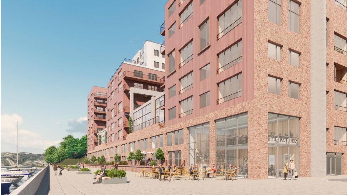
Vy mot Kafferosteriet från den nya strandpromenaden på industrikajen.

strandpromenaden runt Svindersviken. En annan central plats uppstår vid Kafferosteriet där industrikajen blir ett publikt stråk som del av den nya strandpromenaden.