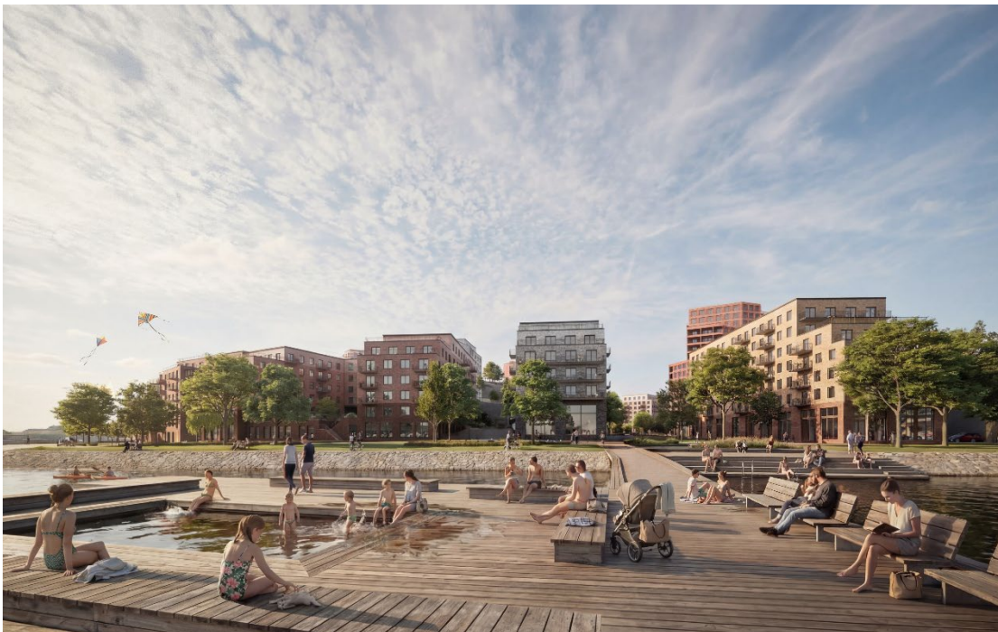
Vy från föreslagen bryggbadanläggning i Svindersviken mot den föreslagna nya bebyggelsen. Bild: Kjellander Sjöberg

Förbindelsen bedöms göra det väldigt attraktivt att cykla till närmaste tunnelbanestation i Sickla, och kombinationsresor bestående av cykel plus tunnelbana blir ett snabbt och kapacitetsstarkt sätt att ta sig från planområdet till stora delar av regionen. Detta bidrar i sin tur till en kraftig minskning av behovet av att resa till och från området med bil, vilket i kombination med mobilitetsåtgärder som byggaktörerna vidtar bedöms göra det möjligt att bygga bostäderna i Gäddviken utan större påverkan på bilköer vid Henriksdalskorset eller på Kvarnholmen. Detta beskrivs utförligt i Trafikstrategi Henriksdal-Kvarnholmen, se ärendet till kommunstyrelsen 2025-12-15 § 359.