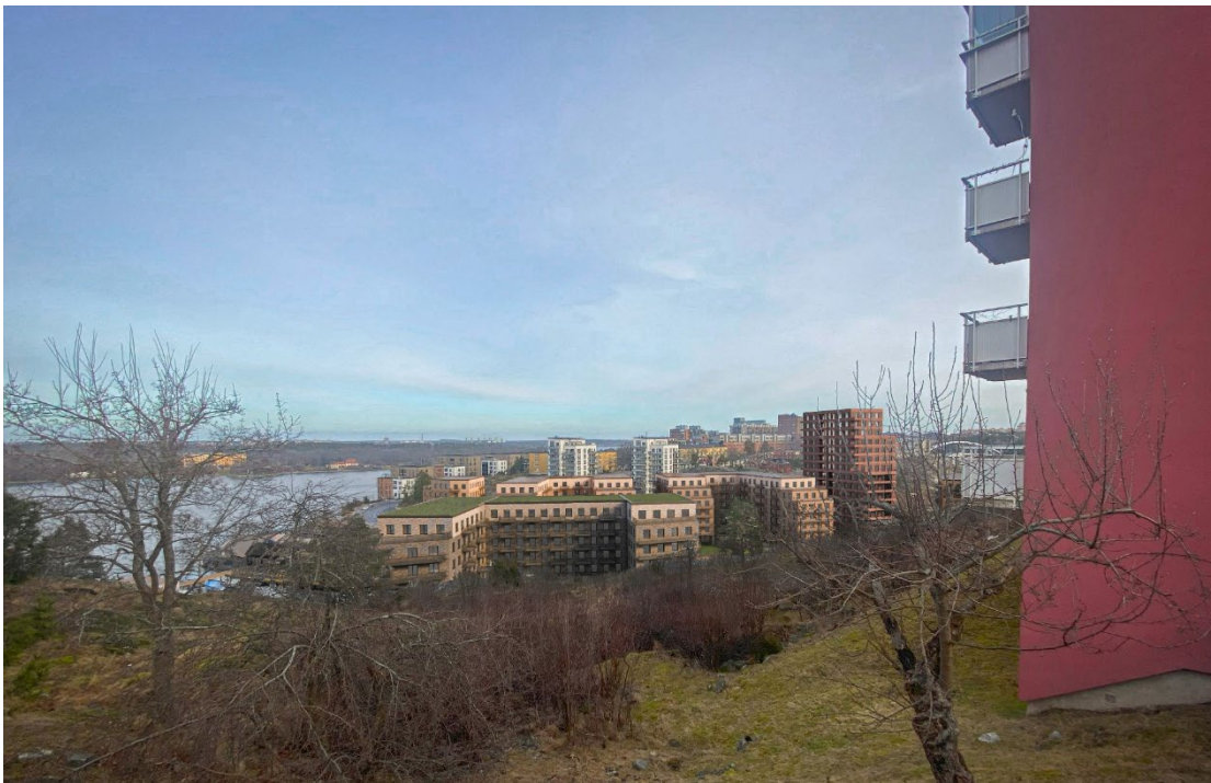
Vy mot föreslagna nya bostadshus från befintligt bostadshus på Finnberget.

Kommunen vidarefakturerar kostnaderna för detaljplanearbetet enligt planavtal. Det finns inga kommunala markintäkter kopplade till projektet eftersom den planerade exploateringen kommer att ske på privatägd mark. Projektet kommer att medföra investeringar i utbyggnaden av det kommunala VA-nätet, vilket finansieras genom anläggningsavgifter. Allmänna platser kommer i huvudsak att anläggas och bekostas av byggaktörerna och därefter lämnas över till kommunen. En av byggaktörerna kommer att betala medfinansieringsersättning för tunnelbanan, vilket dock inte räknas som en intäkt för projektet.