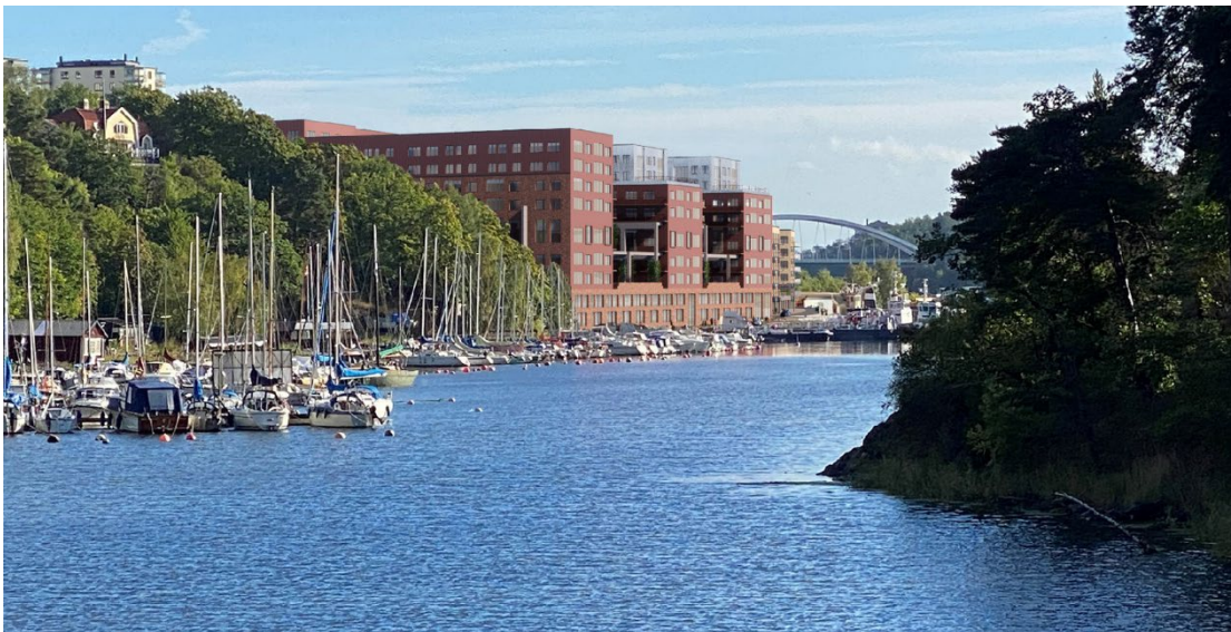
Vy som visar Kafferosteriet ombyggt till bostäder sett västerifrån. Bild: Gatun Arkitekter

Ett mycket omfattande återbruksprojekt planeras avseende den befintliga byggnaden Kafferosteriet. Befintlig betongstomme kommer att bevaras och byggas om till ett bostadshus. Detta är mycket positivt ur klimatsynpunkt och kommer att innebära en mycket stor reduktion i utsläpp jämfört med om byggnaden hade rivits och ersatts med nya byggnader.