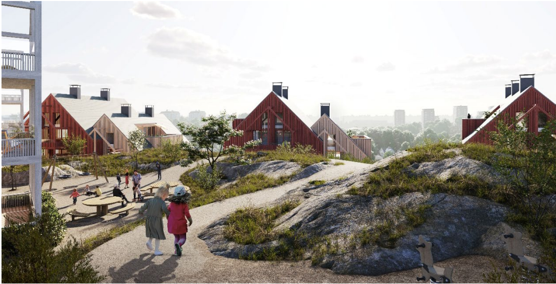
Vy mot de föreslagna bostadshusen sett från den föreslagna förskolegården.

Detaljplanen är en viktig pusselbit i att möjliggöra utbyggnaden av ett kommunalt VA-nät för befintliga bostadsrättsföreningar på Finnberget, som är belägna utanför planområdet. Detta eftersom Finnbergsvägen genom detaljplanen övergår i kommunal ägo vilket ger kommunen rådighet över att förlägga ledningar i Finnbergsvägen.