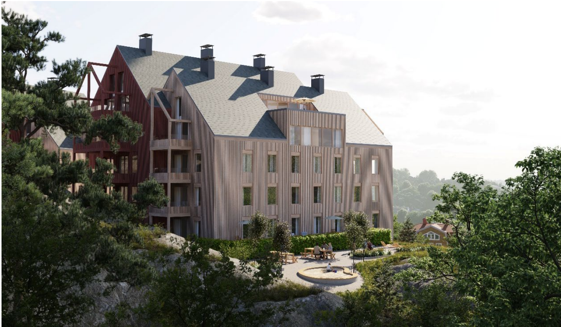
Vy västerifrån mot de föreslagna bostadshusen sett från den naturmark som föreslås bevaras. Bild: Brunberg & Forshed