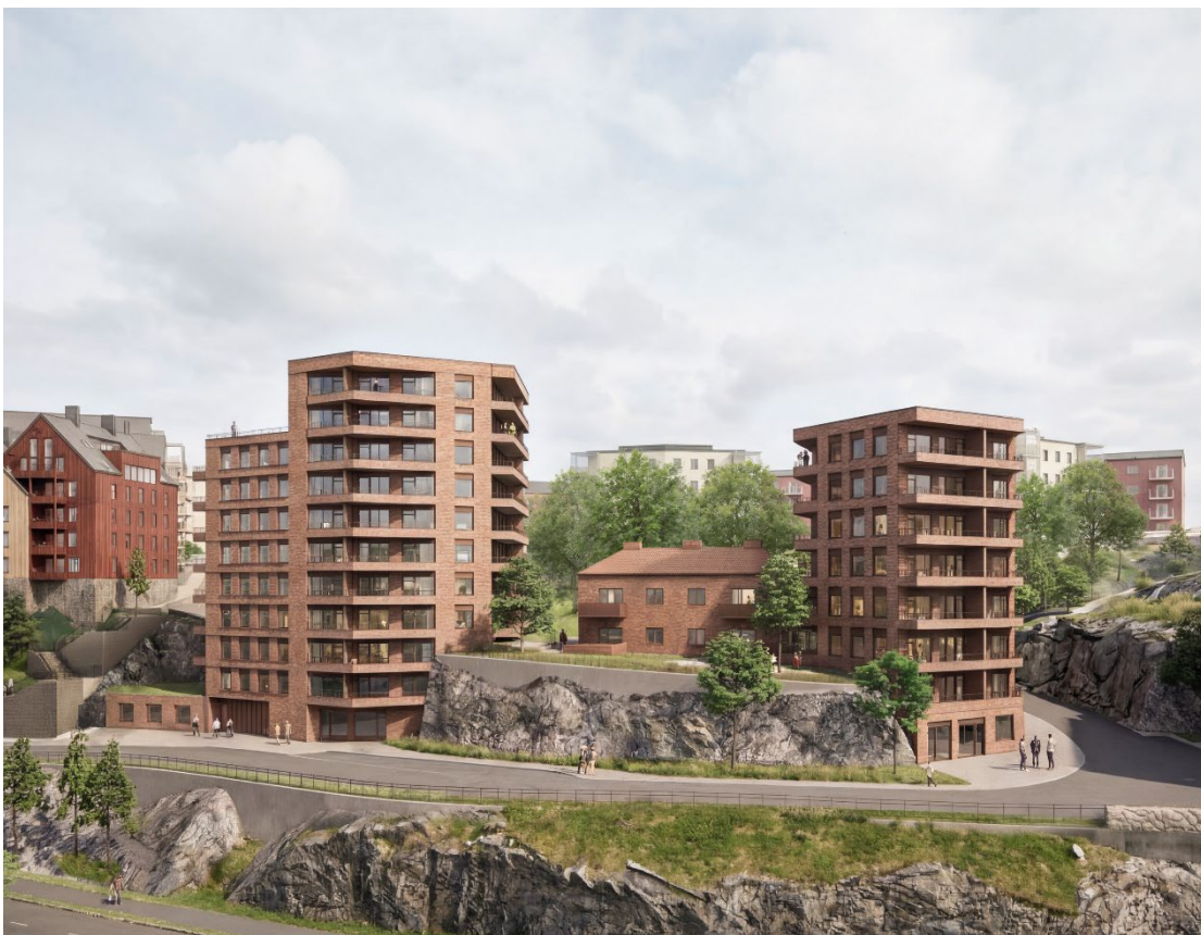
Vy söderifrån mot Förmansbostaden som skyddas i detaljplanen. Byggnaden flankeras av två nya bostadshus. Bild: Kjellander Sjöberg

Utsläppen av att bygga bostäder på platsen bör vägas mot de minskade koldioxidutsläppen och den minskade resursförbrukningen som blir följderna av att fler personer får möjlighet att bo och arbeta centralt i Stockholmsregionen, vilket för många innebär en kortare resväg till arbete och olika former av service jämfört med om motsvarande mängd bostäder och arbetsplatser hade byggts i mer perifera lägen i länet.