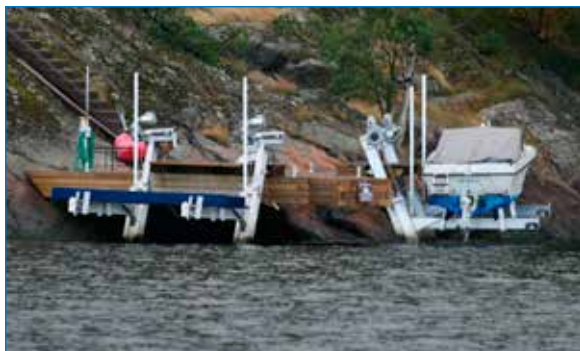
Liten brygga med två båthissar.

Ett sätt att begränsa bryggans storlek kan vara att installera båthiss.