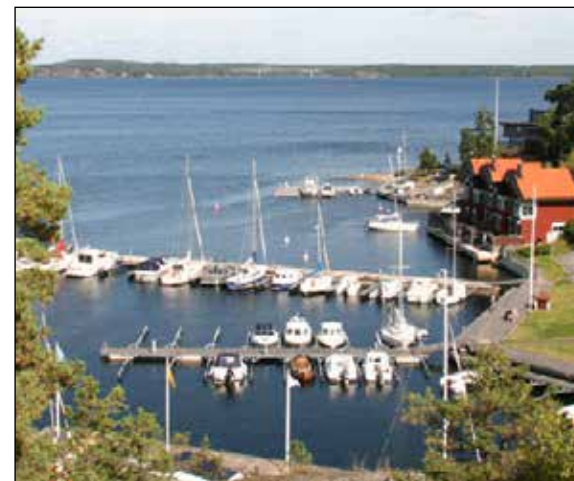
Ett bostadsområde med välordnad gemensam båtplats. Ett exempel på hur samarbete kan ge många plats för ett stort fritidsintresse.

Lagens regler och principer ger ibland inte tillräcklig vägledning. En tolkning från kommunens sida kan också behövas. De här riktlinjerna beskriver frågor som är viktiga när Nacka kommun gör denna tolkning.