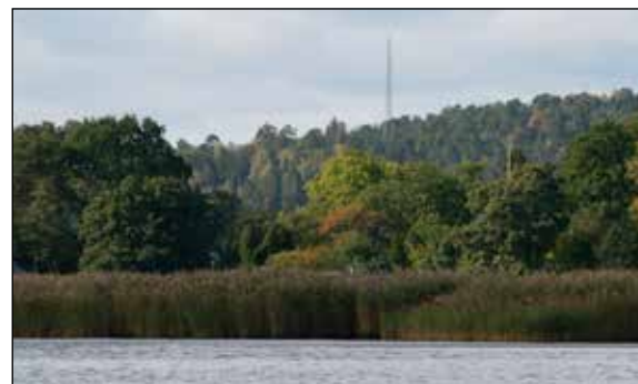
Stora kust- och strandområden måste få förbli opåverkade till nytta för både växt- och djurliv och människor – med vassruggar, lekbottnar, utblickar...