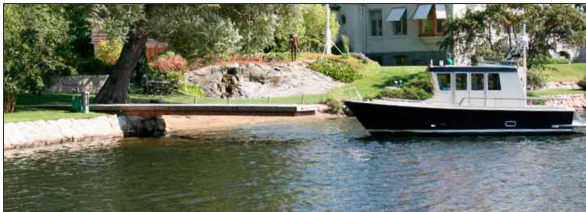
Privat brygga som går ut cirka 10 meter över vattnet.