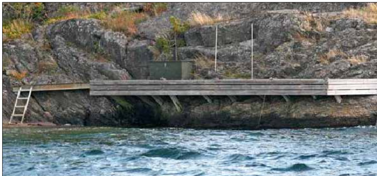
Längsgående brygga som är utformad på ett lämpligt sätt och anpassad till platsen (ett brant strandparti).