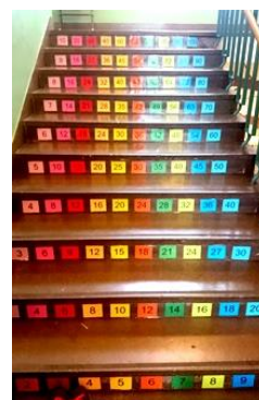
Matematiktablerna i trappan