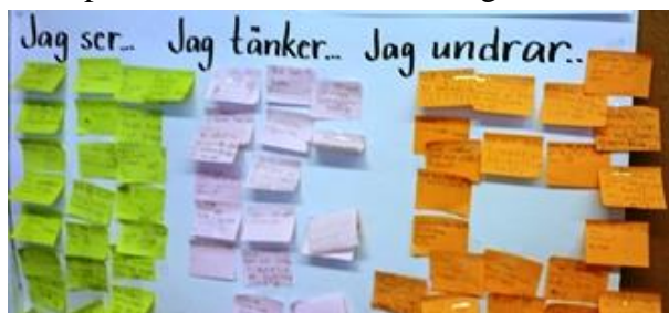
Exempel på arbete med strategier

I alla klassrum och korridorer i skolans alla byggnader finns en mängd pedagogiskt material på väggarna. Vi ser aktuella elevarbeten, pedagogiska planeringar, bedömningskriterier, strategier för lärande på Sickla skola och ämnesspecifika strategier i olika ämnen som exempelvis matematik och läsning.