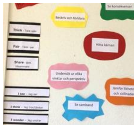
Think- Pair – Share. Exempel på pedagogiskt stöd.

I alla klassrum sitter färgglada lappar med texter som ska hjälpa eleverna i sitt lärande. Det sitter tydliga Pedagogiska planeringar (PP) till pågående arbetsområden i klassrummet i åk 4-6 .