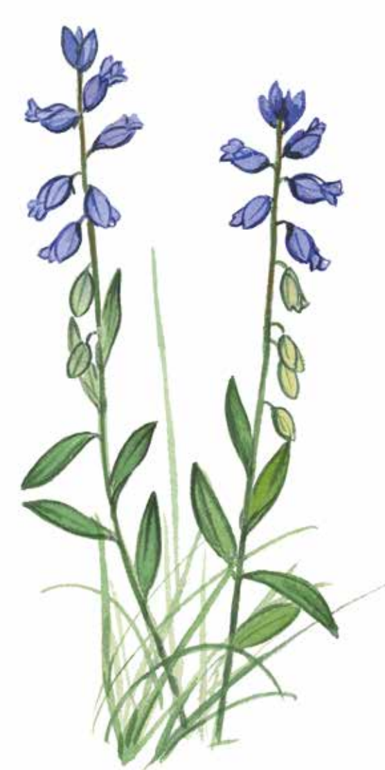
Jungfrulin Polygala vulgaris

Talltickan har en nyckeroll i äldre tallskogar. Den rötter veden och gör den mjuk. Spillkråkan hackar gärna ut sitt bohål nära svampangreppet. Så småningom blir stammen där svampen sitter så svag att den går av. En tallhögstubbe har skapats, där slagugglan och andra ugglor kan bygga bo.