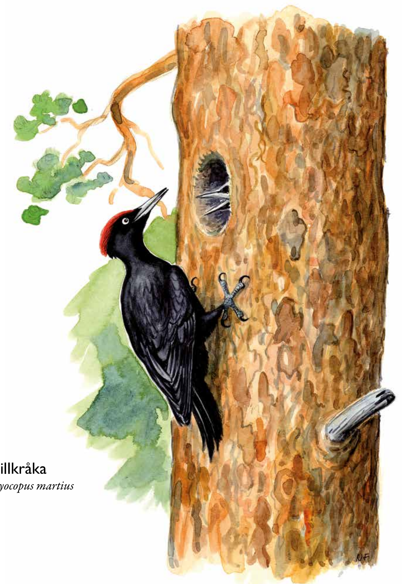
Spillkråka Dryocopus martius

Here at Gärdesudden, a small piece of countryside has been preserved for the future. A green oasis, where no roads or houses can be built. A place for people to relax and explore. But also a haven for rare animals and plants. Here you find pine forest, leafy woods and open meadows. Several rare species of fungi, lichens and insects are associated with the old pines. The deciduous wood and open meadows also harbour a rich flora and fauna. Several paths go through the reserve. Some lead out to the tip of the promontory and offer fine views across the fairway leading to Stockholm and the giant ferries that go past.