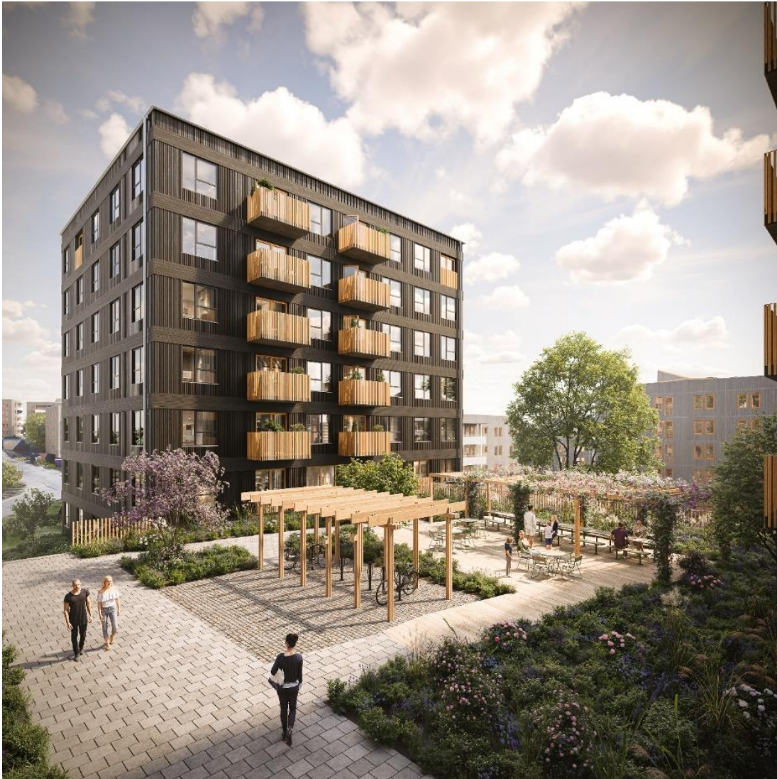
Figur 2. Visionsbild över "Soliga gården", med plats för social interaktion, (Vida och White, 2025).