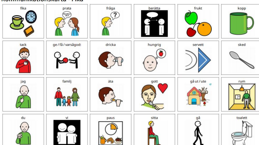
Kommunikationskarta - Fika