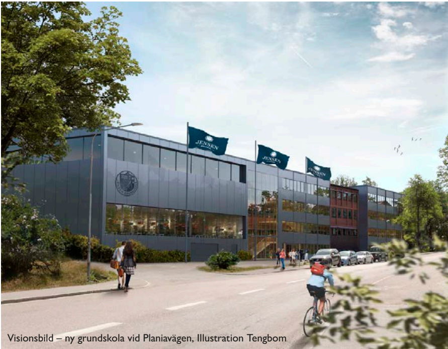
Visionsbild – ny grundskola vid Planiavägen, Illustration Tengbom