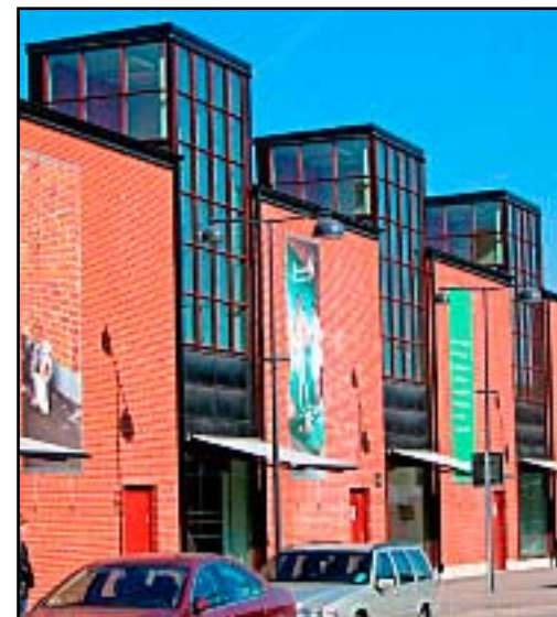
Vepor på Sickla Galleria.

Vepan ska anpassas till byggnaden som sådan och vara direkt kopplad till verksamheten på platsen. En kampanj ska inte direkt avlösas av en annan.