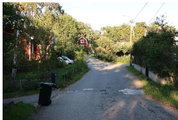
Figur 23. Äldre villabebyggelse vid Eklundavägen.

I Eknäs finns också exempel på förtätning där villatomter har omvandlats till små flerbostadshus eller radhus. Sådana tomter saknar i allmänhet helt den landskapsanpassning och grönska som präglar resten av villabebyggelsen.