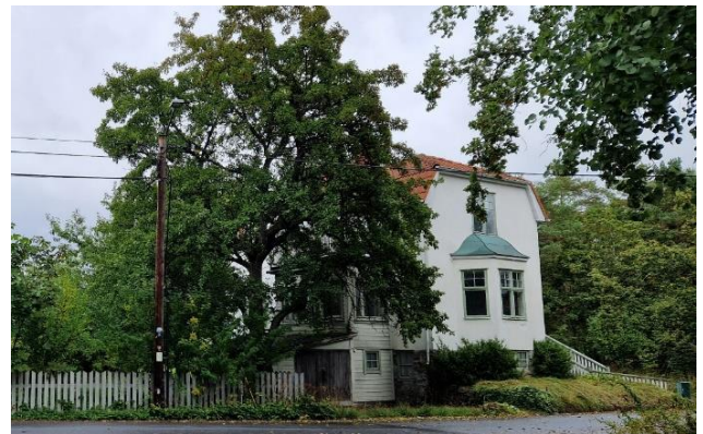
Figur 19. Äldre villa med stor trädgård vid Kocktorpsvägen.

Karaktären är dock inte helt enhetlig, villor från senare epoker ligger bland de äldre villorna. Landskapets former speglar sig även utanför tomtmarken och i gaturummen skapar flera stora träd, rik naturlig vegetation och få hårdgjorda ytor en grön inramning. Området med de bevarade äldre villorna i den kuperade terrängen med sina stora trädgårdar och gamla träd visar mycket väl den tidiga egnahemsbebyggelsen i Björknäs.