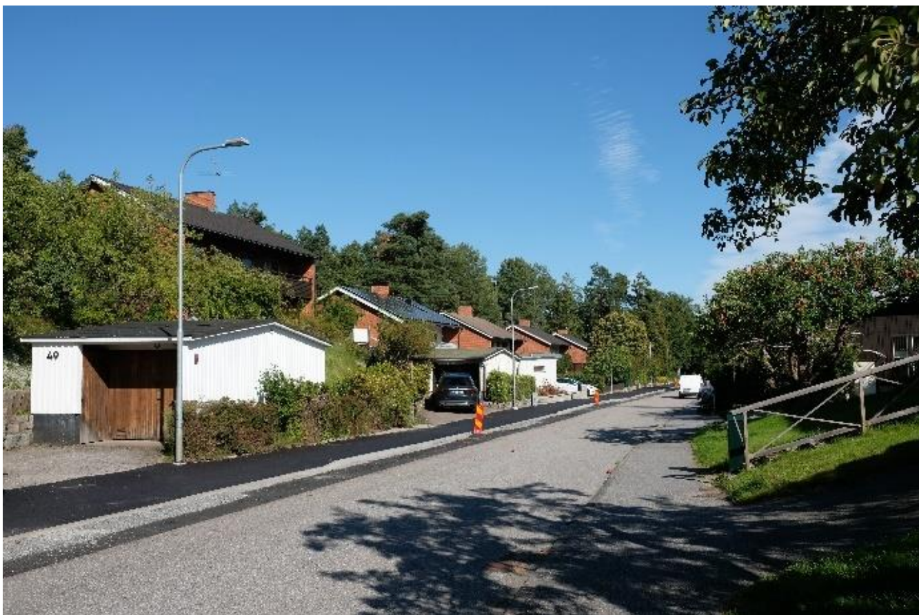
Figur 18. Lövdalsvägens dalgång med 1960-talets suterrängvillor. Dalgången, hällmarksvegetationen i bakkant av tomterna och trädgårdarna skapar ett grönt rum.

Bebyggelsen har bevarat sina ursprungliga karaktärsdrag mycket väl. Tillsammans med trädgårdarna och den grönskande omgivningen skapas ett område med en helt egen och lätt avläsbar, bitvis parklik karaktär.