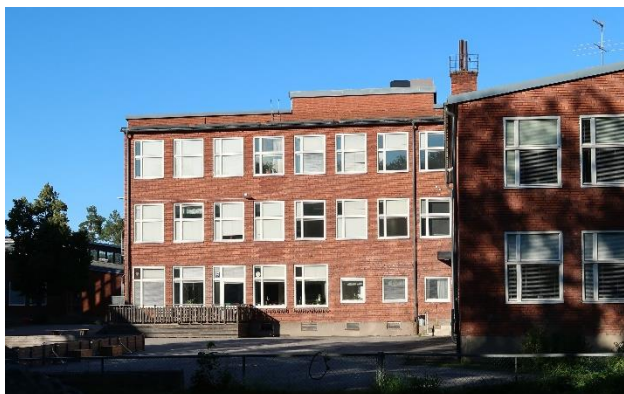
Figur 26. 1950-talets skolhusarkitektur vid Björknässkolan.

Öster om skolgården ligger Björknäs IP som invigdes 1967. Idrottsplatsen rymmer idag en idrottshall, fotbollsplan med friidrottsanläggning samt två isytor i isladan och istältet.