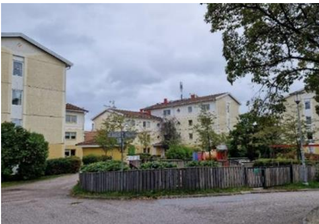
Figur 6. Gårdsmiljö på Ängsbacken.

Byggnadshöjden varierar mellan två och fyra våningar med suterrängvåningar. Formspråket, både fasadernas synliga betongelement, pastellkulörerna och byggnadsdetaljerna, är mycket tidstypiskt. Innergårdarna är gemensamma och inom området finns en lekplats i anslutning till en förskola. Gårdarna är nästan bilfria och området mycket lättillgängligt för oskyddade trafikanter genom gång- och cykelvägar.