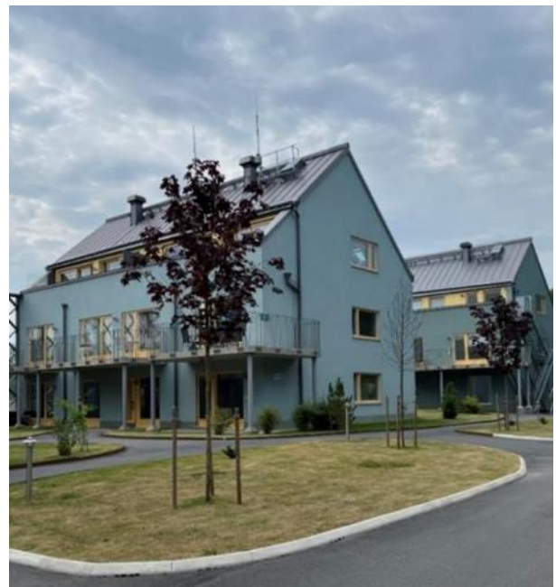
Figur 10. Flerbostadshus från 2020, Kocktorpsvägen.

Vid Kocktorpsvägen finns en mindre grupp med flerbostadshus som representerar den senaste utbyggnadsepoken i Björknäs. Husen som uppfördes 2019-2020 står på en höjd norr om Värmdöleden och utmärks genom sin placering på rad med de branta gavlarna vända mot vägen och av sina blågröna putsfasader och gula fönster. Mot motorvägen finns både bullerplank i vägslänten och höga bullerskärmar med spaljéliknande utseende mellan husen. Landskapet omkring husen är mycket ordnat med anlagda gräsmattor på platsen för en äldre villaträdgård.