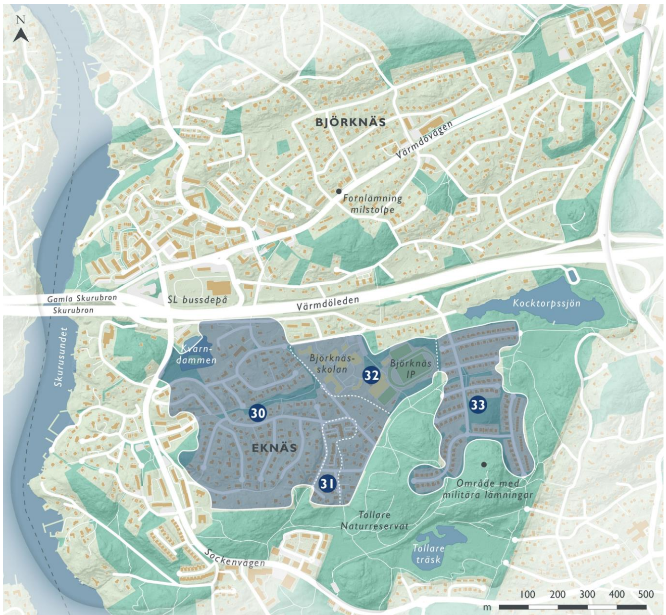
Figur 28. Landskaps- och bebyggelsekaraktärer i villabebyggelsen i Eknäs, delområde 30 - 33.