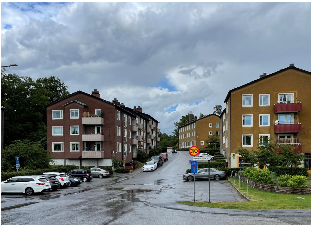
Figur 8. 1950-talsbebyggelse längs Trädgårdsvägen i Eknäs.