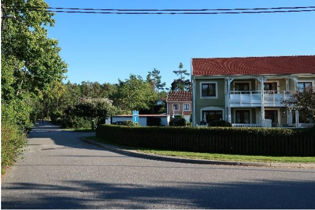
Figur 25. Radhus från 1980-talet vid Apollonvägen.

Parhusen utmärks av sina röda tegelfasader och branta sadeltak med takkupor. Slutningsläget gör att bebyggelsen är väl anpassad till landskapet, men jämfört med de intilliggande villorna är skalan något högre.