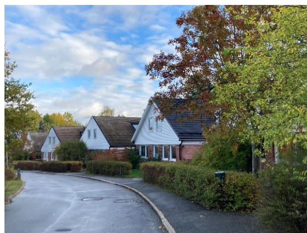
Figur 27. Hjortängens karaktäristiska bebyggelsestruktur.

De första husen färdigställdes vid årsskiftet 1969-1970. Enligt samtida uppgifter kunde husen vara inflyttningsklara redan två veckor efter leverans. Genom en planändring 1976 möjliggjordes att de ursprungliga enplanshusen kunde byggas på med en vindsvåning under ett brant sadeltak. Detta har lett till att hushöjderna varierar mellan olika gator. Fasaderna på både grändhusen och radhusen är klädda med rött fasadtegel. Gavlar och takfot är på grändhusen, oavsett takform, klädda med liggande, vitmålad fjällpanel, medan radhusen har fjällpanel i mörkbrun kulör.