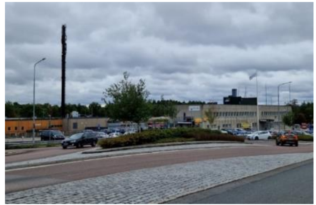
Figur 9. Bussgaraget sett från Värmdövägen.

För alla som färdas på Värmdöleden är bussdepån i Björknäs ett välkänt landmärke, men för Björknäsbor och Eknäsbor är området en påtaglig barriär både visuellt och fysiskt. Kontorsbyggnaden vid Värmdövägen har drag av 1970-talets betongbrutalism, medan den stora verkstadsbyggnaden är lätt att känna igen med sina brunorange plåtfasader. Lika kännetecknande är de stora parkeringsytorna med rader av parkerade bussar. Området saknar vegetation förutom två stora ekar i sydvästra hörnet av parkeringen som påminner om att bussdepån ligger på platsen för Stora Björknäs gårds ekonomibygnader. Till det storskaliga vägrummet hör även en bensinstation väster om Sockenvägen och en infartsparkering.