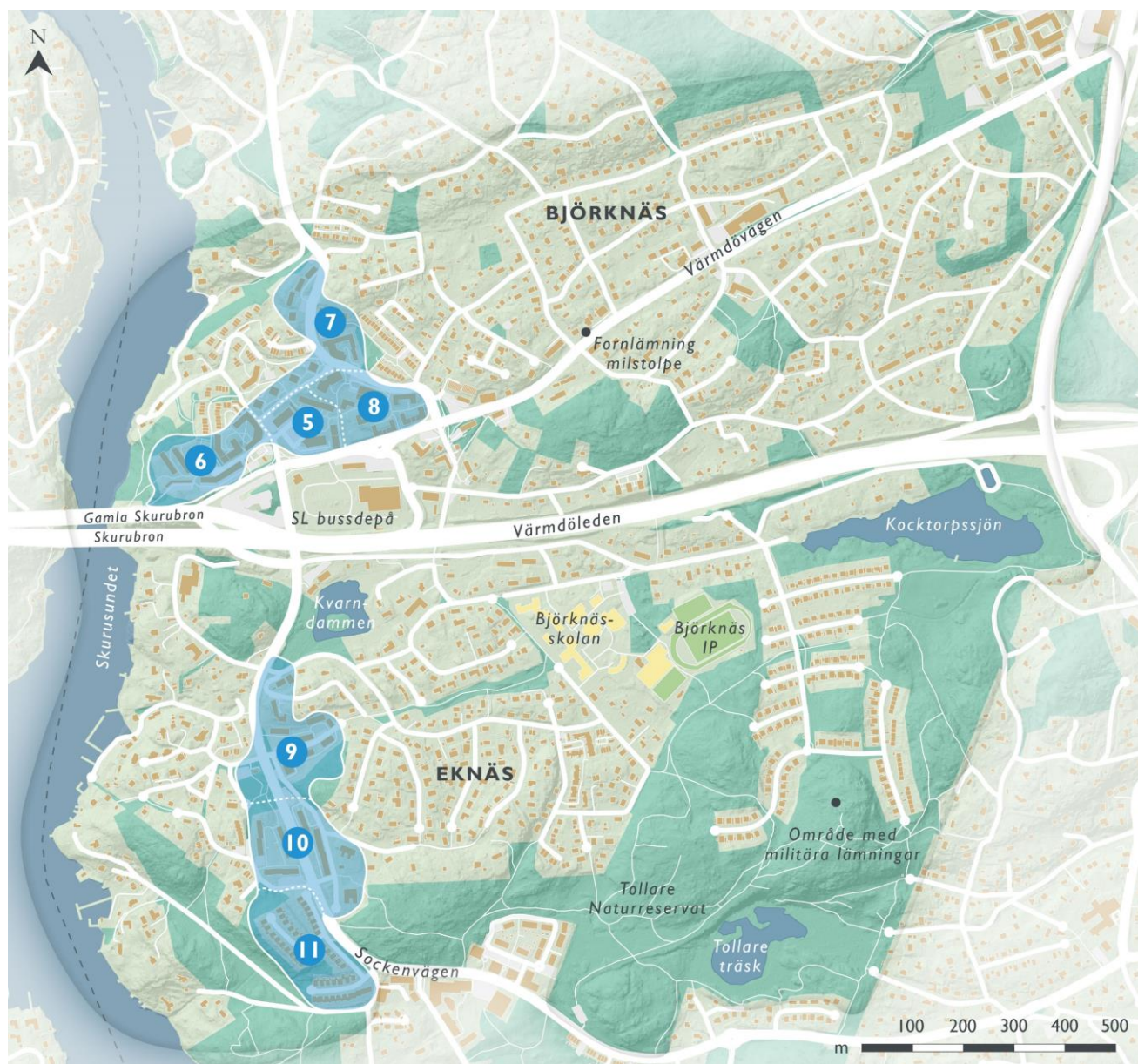
Figur 5. Centrumområdenas landskaps- och bebyggelsekaraktärer, delområde 5 - 11.

Nacka Seniorcenter Sofiero vid Talluddsvägen uppfördes som Boo kommuns ålderdomshem år 1955 och visar tidens höga sociala ambitioner. Bebyggelsen i två till tre våningar med gulputsade fasader och flera tidstypiska detaljer står kring en gemensam gård. I början av 1990-talet gjordes en i både utformning och volym fint anpassad tillbyggnad.