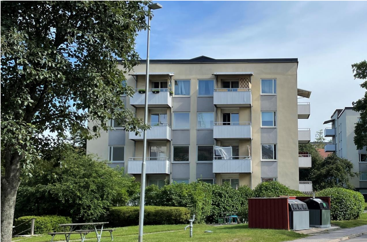
Figur 7. Flerbostadshus från det sena 1950-talet norr om Björknäs centrum.