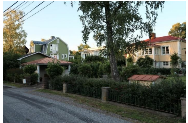
Figur 16. Äldre villabebyggelse vid Lövdalsvägen.

Längs Skogdalsvägen, Plantvägen och Lövdalsvägen ligger ett relativt flackt område som präglas av stora tomter med bevarade gamla träd och rik grönska.