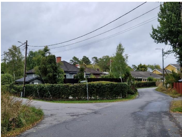
Figur 21. Varierad villabebyggelse vid Skjutbanevägen-Bågspännarvägen.