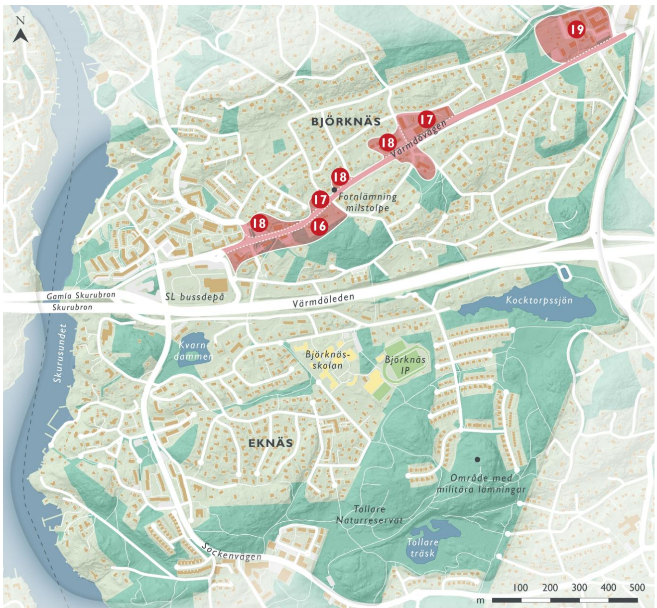
Figur 13. Landskaps- och bebyggelsekaraktärer vid Värmdövägen, delområde 16 - 19.

Längre österut vid Mercuriusvägen och intill 1950-talshusen vid Vintervägen finns ytterligare två flerbostadshus från 2010-talet som genom sina byggnadshöjder i upp till fyra våningar, i kombination med fasadutformningen och byggnadsdetaljerna, gör att byggnaderna skiljer sig markant från omgivningen och tar stor plats i landskapet.