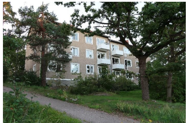
Figur 14. Välbevarat flerbostadshus vid Lövdalsvägen.