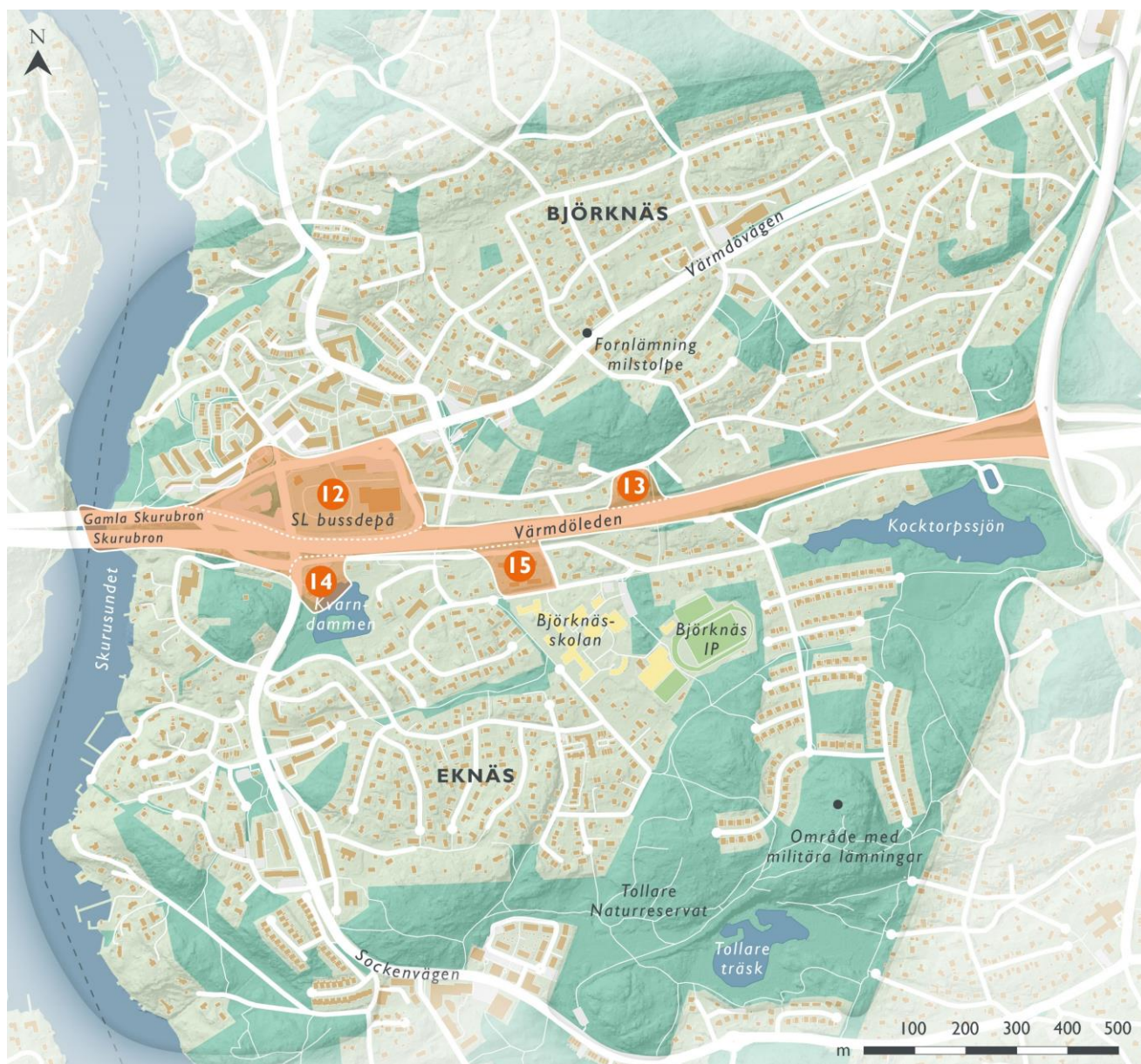
Figur 11. Landskaps- och bebyggelsekaraktärer vid Värmdöleden, delområde 12 - 15.

Längre österut mellan Värmdöleden och Björknäs skolväg finns ett mindre område med 20 radhuslägenheter i tre längor med sadeltak och träfasader i gråa kulörer. Stora delar av området saknar naturlig växtlighet och då radhusen ersatt fyra äldre villor med trädgårdstomter har hårdgjorda ytor ökat i ett tidigare lummigt område. En växtklädd bullervall skyddar området från buller mot motorvägen.