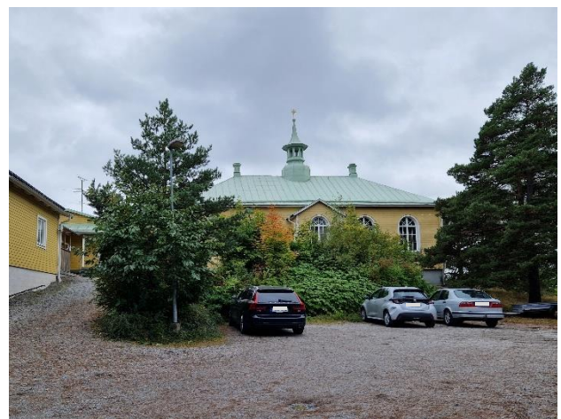
Figur 12. Björknäskyrkan.

Björknäskyrkan har trots förändringar bevarat sin ursprungliga karaktär och fungerar som ett landmärke på sin skogsklädda höjd. Byggnaden har även samhällshistoriska värden.