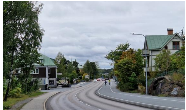
Figur 13. Vy över Värmdövägen västerut med Centralkonditoriet och Björknäskyrkan till vänster. En av områdets äldsta villor syns till höger i bilden.

med små servicebyggnader intill en kraftledningsgata och en infartsparkering.