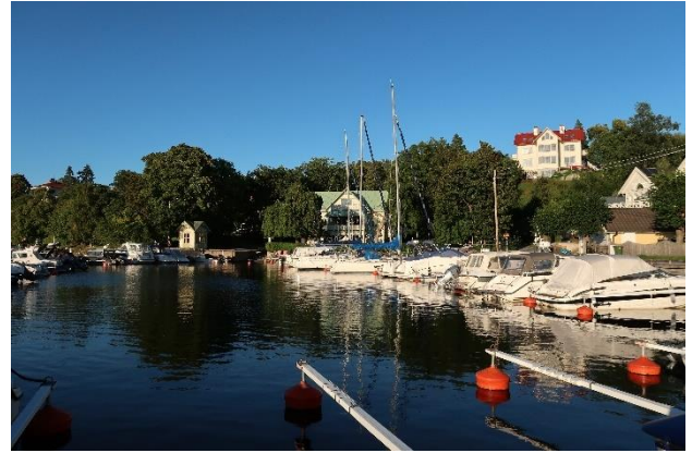
Figur 2. Skurusundet vid Eknäs.

Något längre bort från vattnet står flera mindre grupper av radhus och parhus främst från 1960-70-talen i det topografiskt varierade landskapet. Bebyggelsen förhåller sig väl till trädens naturliga höjdskala och har anpassats till de topografiska förutsättningarna. Majoriteten av husen är därför dolda från Skurusundet och gör inget intryck i siluetten. Utformningen varierar men de flesta har träfasader i gult, rött och vitt.