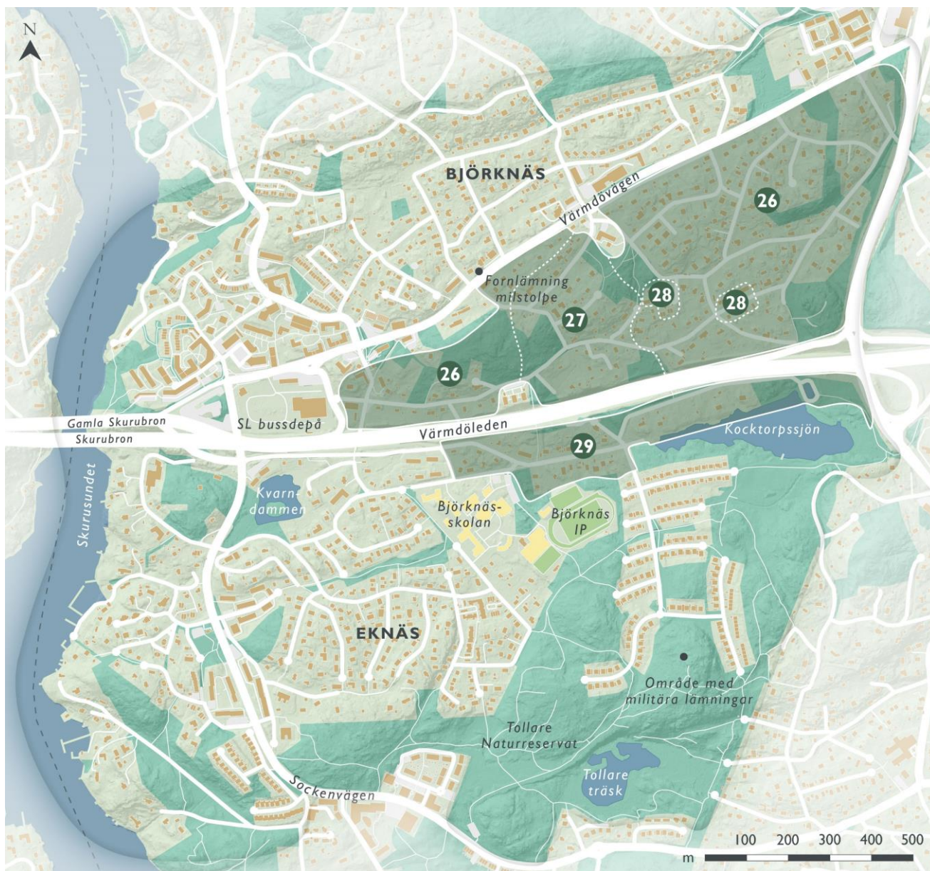
Figur 22. Landskaps- och bebyggelsekaraktärer i villabebyggelsen i Kocktorp, delområde 26 - 29.