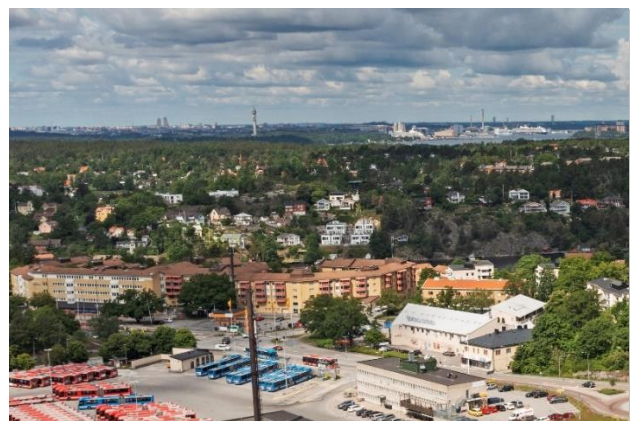
Figur 5. Flygvy över Björknäs centrum.

Väster om centrumbebyggelsen och intill gamla Skurubrons landfäste ligger ett större område med flerbostadshus från 1980-talets mitt. Bebyggelsen är anpassad till terrängen och kombinerar tidstypisk storgårdsstruktur närmast centrumet med lamellhus i slutningen ner mot Skurusundet. För den generellt låga bebyggelseskalan i Björknäs är området storskaligt med upp till fem våningar i storgårdskvarteren. Läget gör att flera lägenheter har utsikt mot sundet, men medför också att de högre delarna höjer sig över trädlinjen och utgör ett större inslag i silhuetten från vattnet. Bebyggelsen med fasader av gult tegel och röda balkonger har visst drag av postmodernism. Söder om flerbostadshusen ligger ett kontorshus i fyra till fem våningar med liknande formspråk som även fungerar som ett bullerskydd mot trafiken.