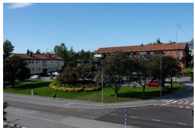
Figur 15. Boo gamla kommuncentrum med två generationers kommunhus och torget som visar platsens tidigare funktion.