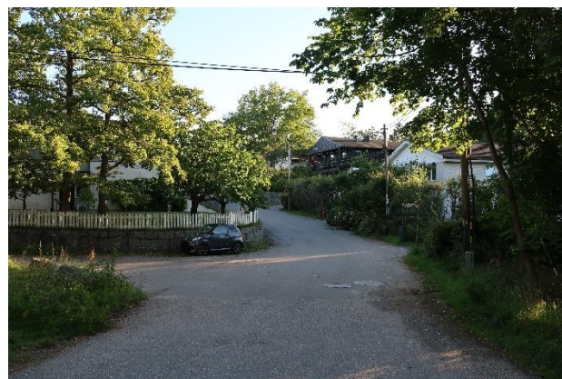
Figur 24. Villabebyggelse från 1970-talet vid Bromsvägen.