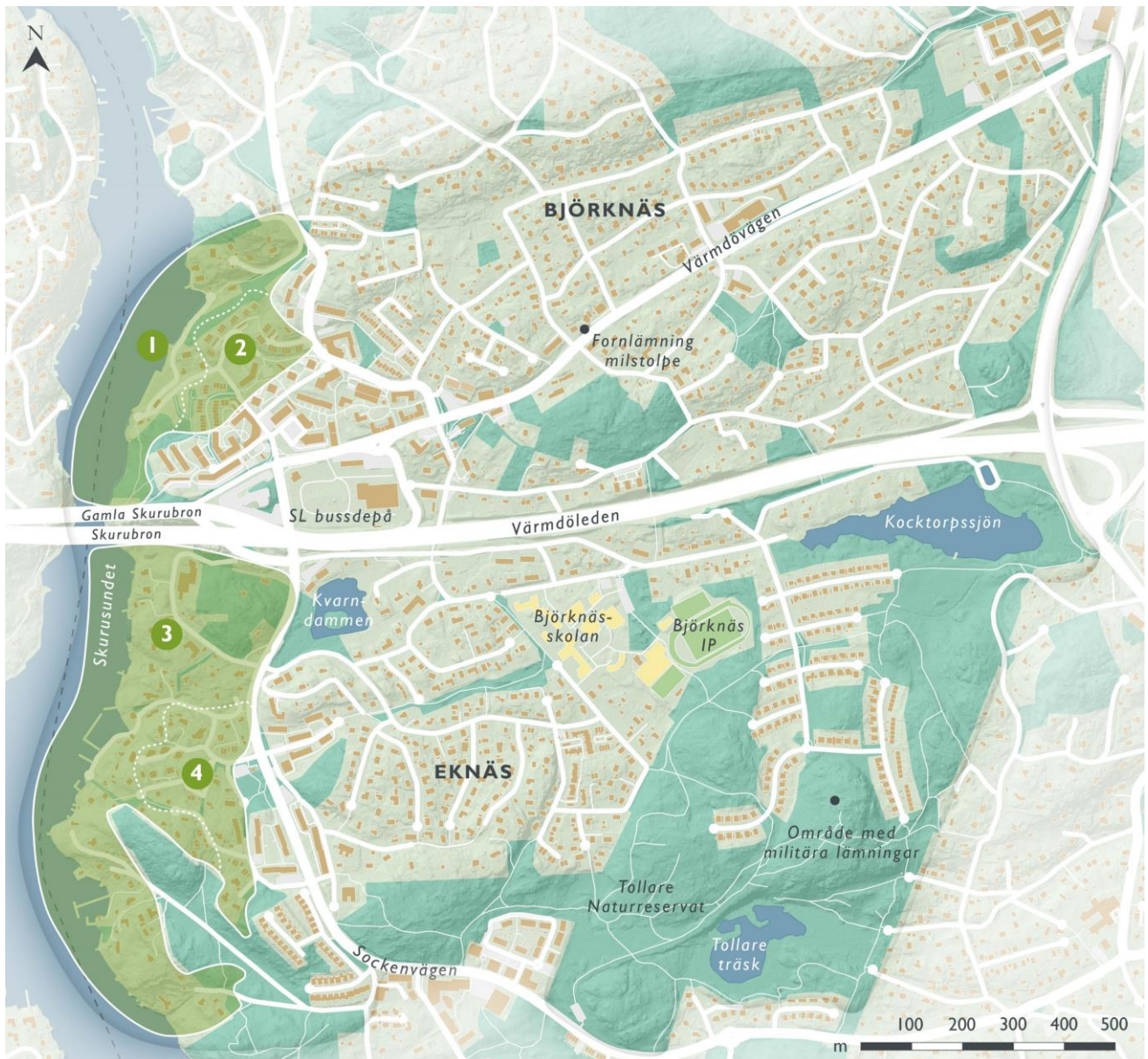
Figur 3. Kustlandskapets landskaps- och bebyggelsekaraktärer, delområde 1 - 4.