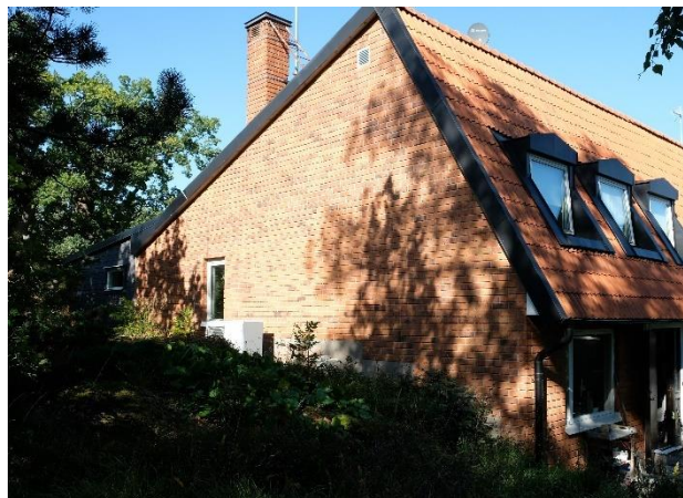
Figur 20. Radhusen med sina karaktäristiska tak och tegelgavlar.

Vid Häckvägen i en fläckade del av området finns både parhus från 1980-talet och mindre flerbostadshus från 2020-talet. De äldre parhusen är tidstypiska kataloghus med ljusa träfasader, medan 2020-talets komplettering skiljer sig genom den något större skalan och den nutida, återhållsamma utformningen med grå träfasader och plåttäckta sadeltak med frontespiser.