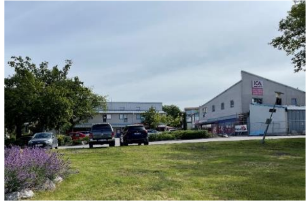
Figur 4. 1980-talets centrumbebyggelse i Björknäs centrum

Byggnaderna vänder sig inåt vilket skapar en intim platskänsla vid torget, samtidigt som orienteringen ger en baksideskänsla utåt mot Värmdövägen. Detta förstärks av det storskaliga vägrummet med parkeringsytor, SL:s bussdepå och Värmdöleden med sin påtagliga barriär mot Eknäs. Torget används idag främst som en parkeringsyta, men här finns insprängd naturlig vegetation. I väster, norr och öster ramas centrumområdet av områden med flerbostadshus och radhus. Gränsen mellan allmänna och privata platser är ofta otydlig och det kan vara svårt för fotgängare och cyklister att orientera sig i området. Det saknas även större gemensamma allmänna ytor som parker och allmänna lekplatser.