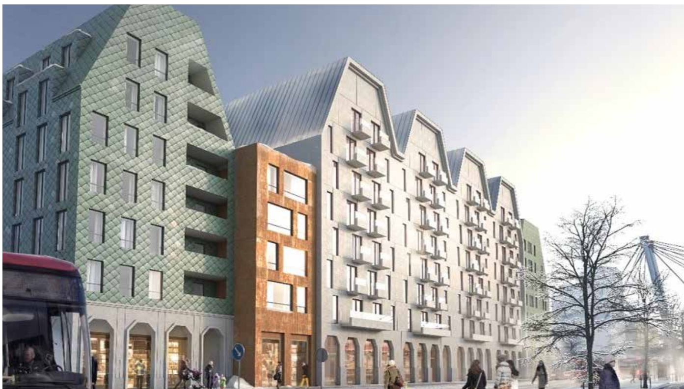
Visionsbild över hur Mensättravägen kan komma att se ut. Bild: Brunnberg &amp; Forshed.