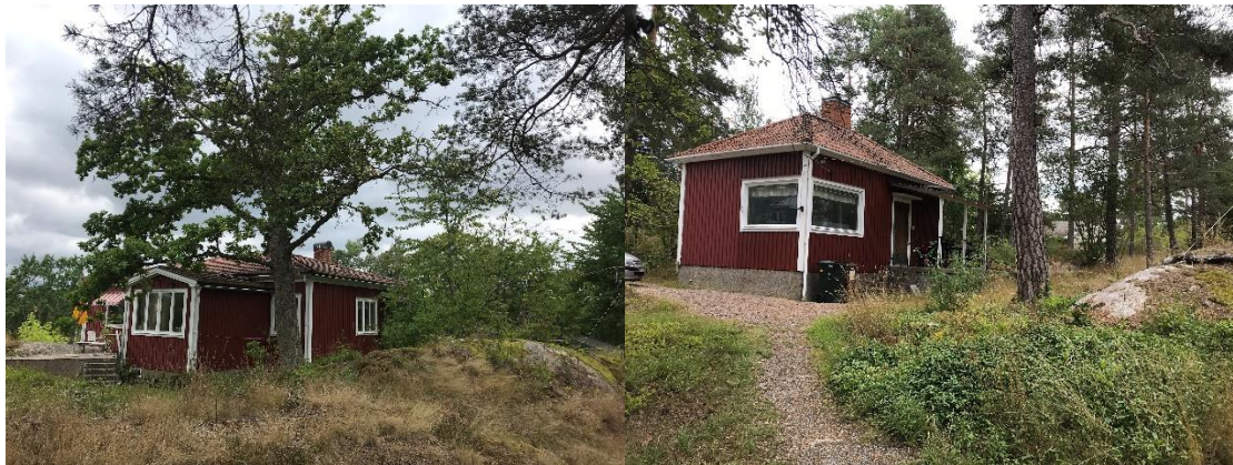
Tv: Huvudbyggnaden på Björknäs 10:124 med bevarandevärd ek intill. Tb: Den mindre byggnaden omgiven av äldre tallar

Vad gäller byggnaderna på fastigheterna Björknäs 10:123 respektive 10:118, ligger delar av byggnaderna på prickmark (mark som inte får bebyggas) i gällande plan. I det ena fallet beror avvikelsen på bristfällig inventering inför planläggning. I det andra fallet är avvikelsen accepterad som mindre avvikelse enligt PBL vid tidigare bygglovsprövning.