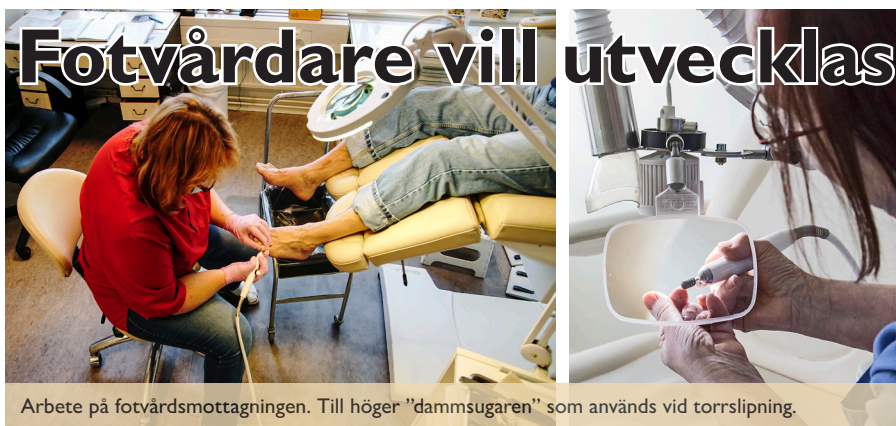
Arbete på fotvårdsmottagningen. Till höger "dammsugaren" som används vid torrslipning.

Hundratals företag från olika branscher behöver känna till och följa miljölagstiftningen. Många får också regelbundna besök av miljöenhetens inspektörer.