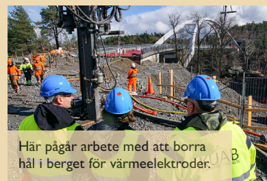
Här pågår arbete med att borra hål i berget för värmeelektroder.

När man planerar för ny bebyggelse i områden med föroreningar krävs det kunskap, bra samarbete och förstärkt förståelse för de uppgifter olika parter har. I det här projektet svarar miljötillsynen i Nacka för olika miljöprovningar. Även om det finns god kunskap om markföroreningar på miljöenheten har man tagit hjälp av fristående expertis för att vara säkra på att välja rätt väg.