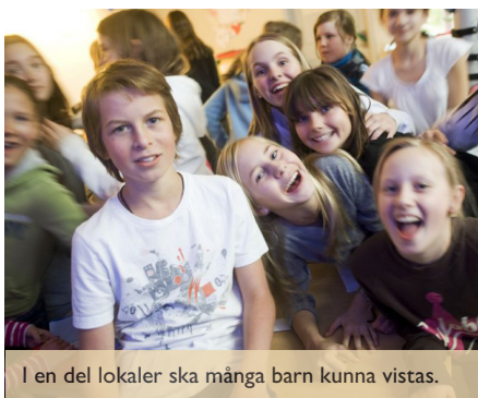
I en del lokaler ska många barn kunna vistas.

kommer fram i ett protokoll, som skolan fått innan.