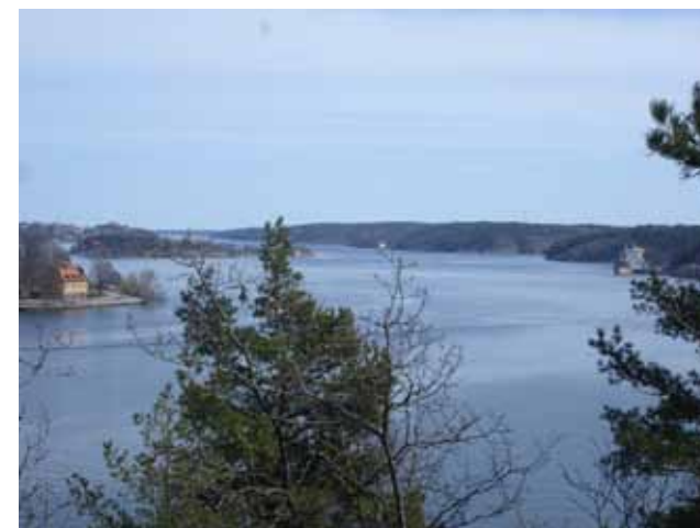
Naturlandskapet dominerar den östra delen av riksintresset. Utsikt från Kvarnholmens östra udde.