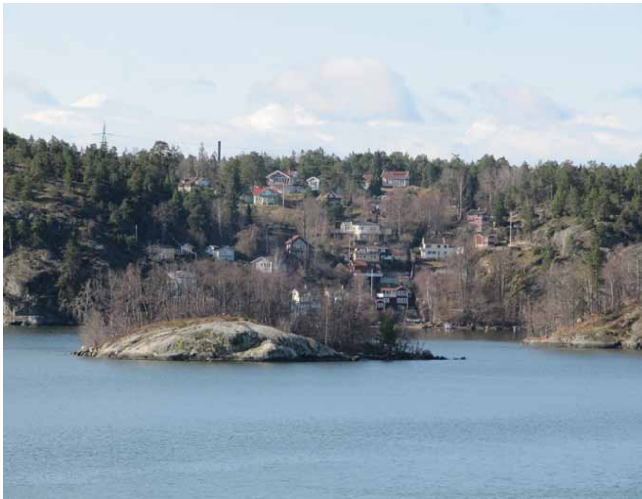
Bebyggelsen underordnar sig det omgivande naturlandskapet. Bilden visar Kungshamn i norra Skuru.

Den östra delen – från Nacka Strand/Augustendal till Tegelön – består av ett glesbebyggt skärgårdslandskap med lågskalig bebyggelse som underordnar sig naturmiljön.