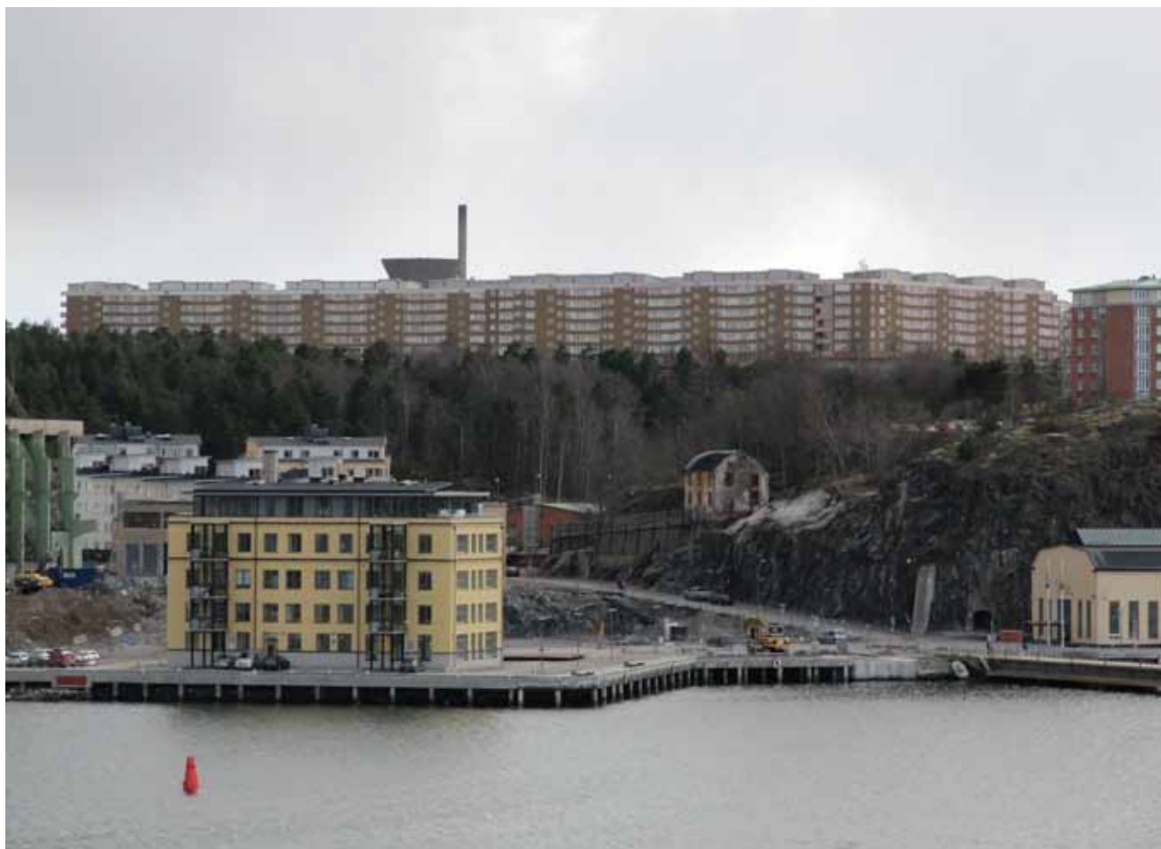
Henriksdalsbergets tunga bostadsbebyggelse med rester av Finnboda varv i förgrunden. Bevarad skärgårdsvegetation i sprickdalslandskapets sluttningar.

Den västra delen – från Saltsjöqvarn till Nacka Strand – präglas av en hög exploatering med f.d. industribebyggelse invid vattnet och flerfamiljsbostäder uppe på berget.