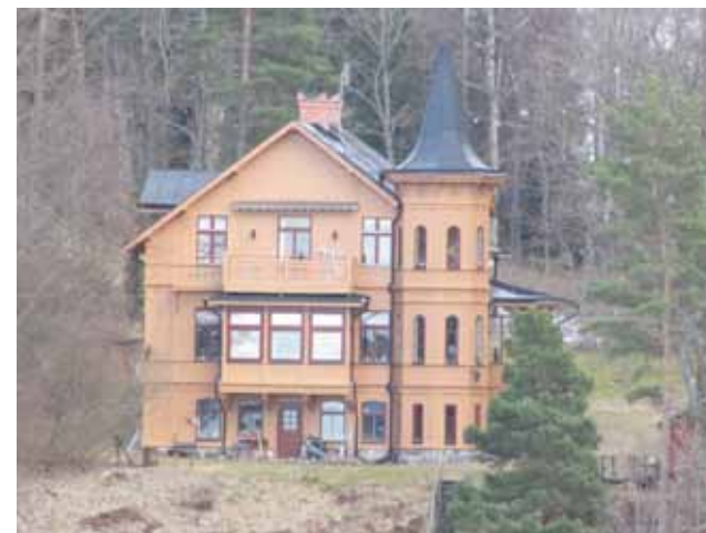
Sommarvilla på stor tomt.