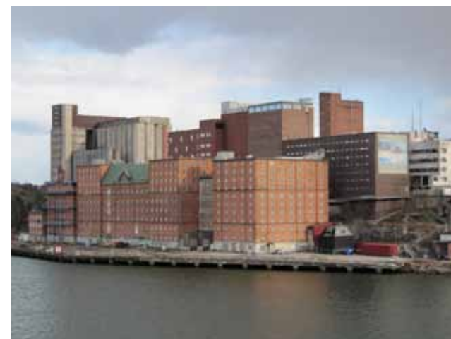
Kvarnholmens täta industribebyggelse (foto 2010).