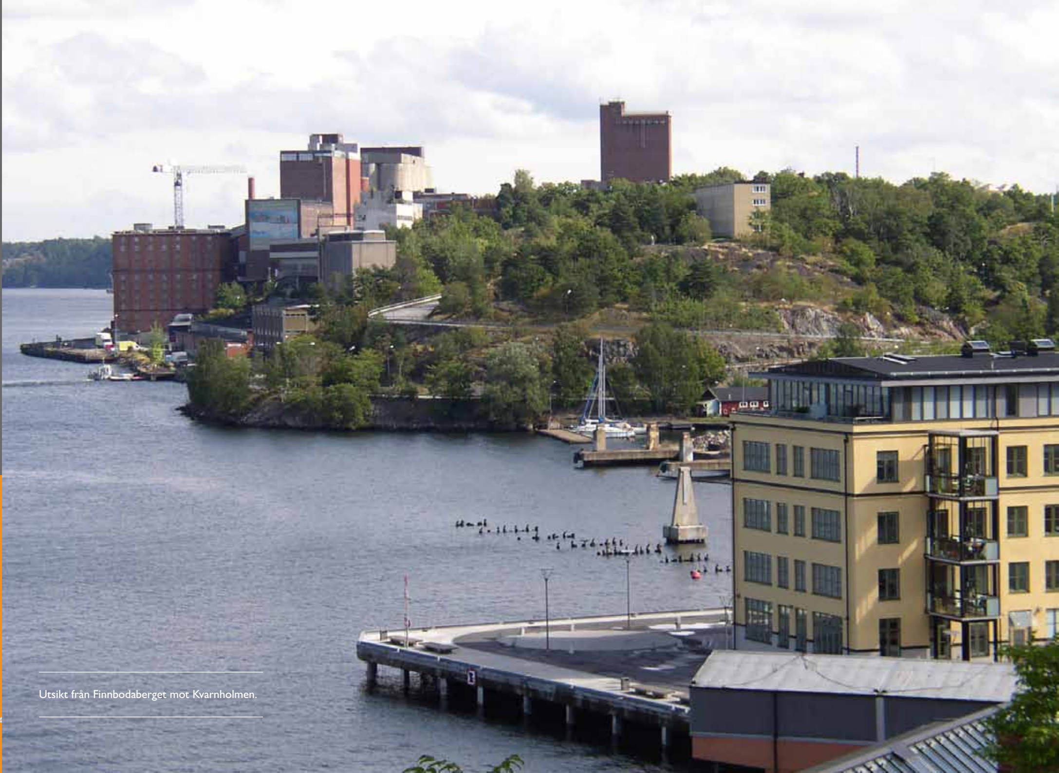
Utsikt från Finnbodaberget mot Kvarnholmen.