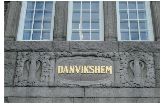
Detalj av portal med inhuggna vasakärvar som anspelar på verksamhetens initiativtagare Gustav Vasa.