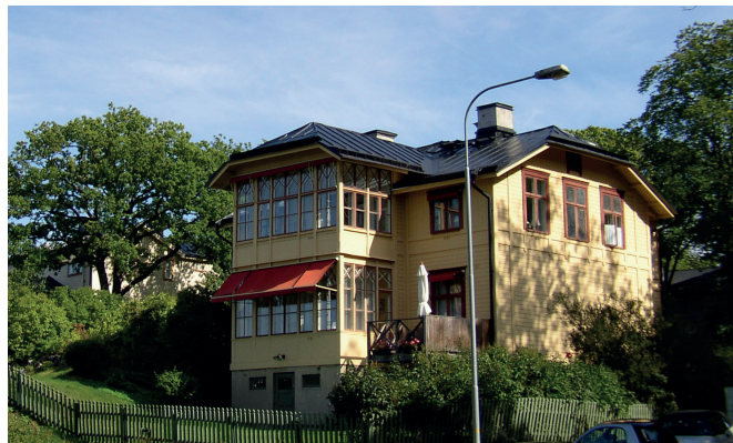
Villa från 1880-talet som byggdes av Finnboda varv som tjänstemannabostad. I backen nedanför, mot strandpromenaden, låg torpet Finnboda som omnämns i 1700-talskällor. Namnet speglar att stället troligen bebotts av finländare.