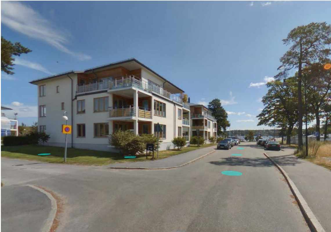
Fotot visar två flerbostadshus som ligger på andra sidan Hotellvägen. Husen är i tre våningar och cirka 17x17meter. Husen planlades i dp 322.

I Nackas Översiktsplan (2018) är området utpekad som medeltät stadsbebyggelse.