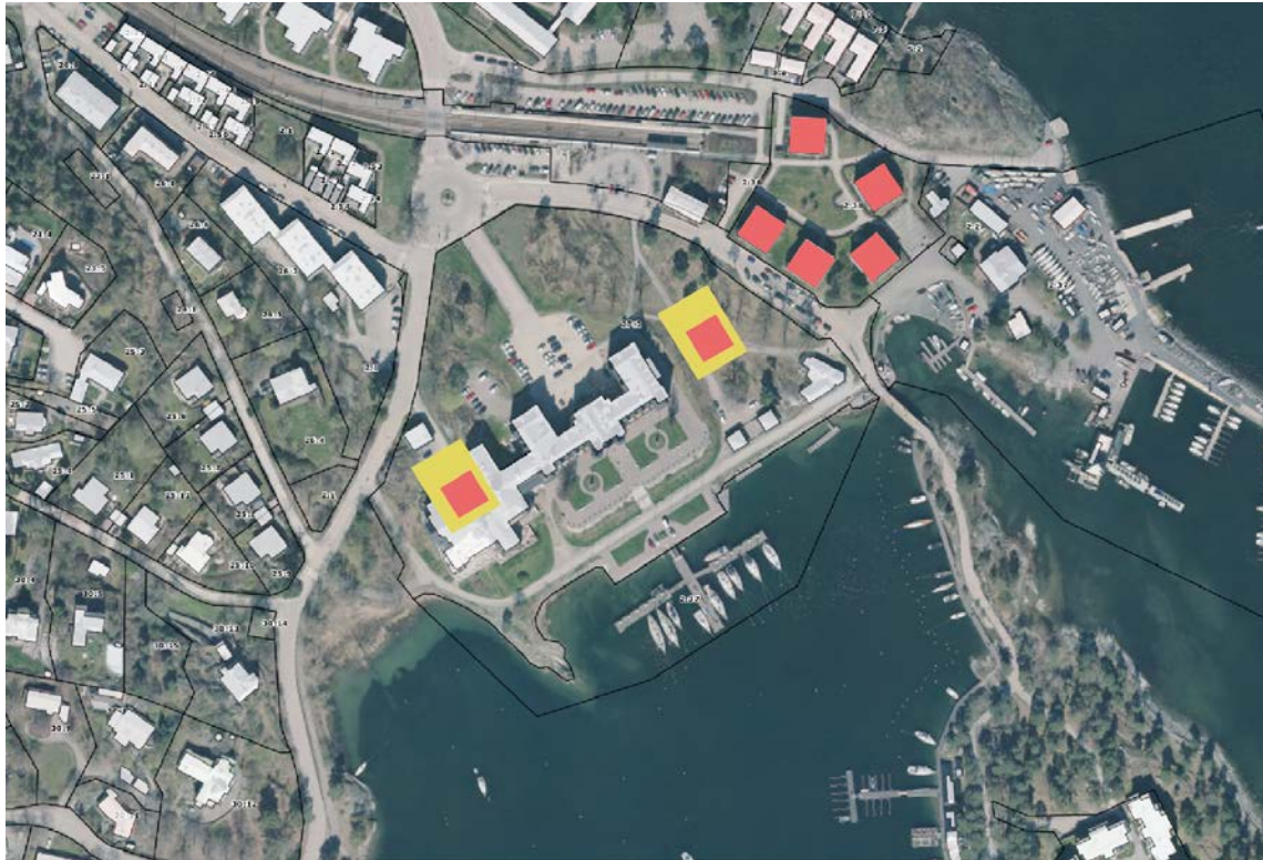
Bilden illustrerar den markyta (röd markering) som befintliga flerbostadshus upptar (cirka 17x17 meter) i relation till den markyta (gul markering) som nya flerbostadshus planeras uppta (cirka 30x40 meter).