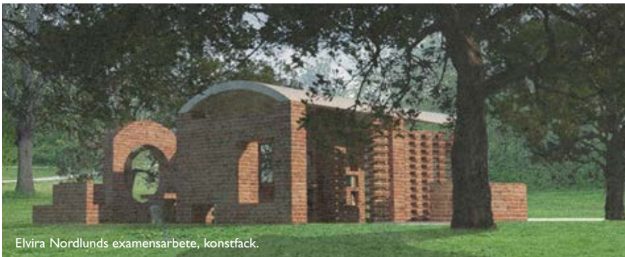
Elvira Nordlunds examensarbete, konstfack.

– Jag tycker att det är jättebra och det har varit intressant att sätta sig in i kartläggningen som gjorts av området. Där kan man se vilka otroliga tillgångar och vilken potential som finns i Orminge.