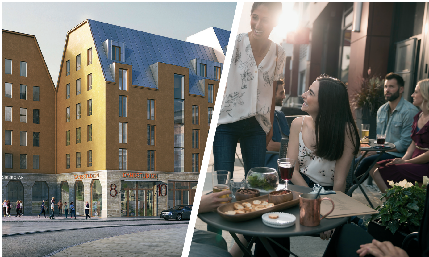
Visionsbild över hur Mensättravägen kan komma att se ut. Bild: Brunnberg &amp; Forshed.