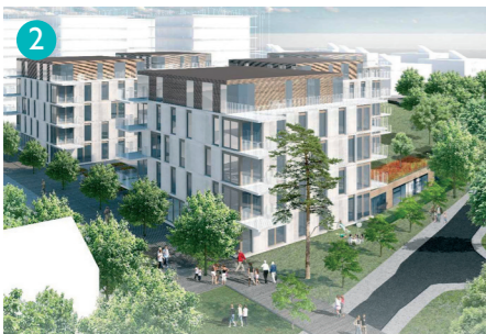
Visionsbild över hur Nybackakvarterets västra del kan komma att se ut. Bild: Scheiwiler Svensson Arkitektkontor.