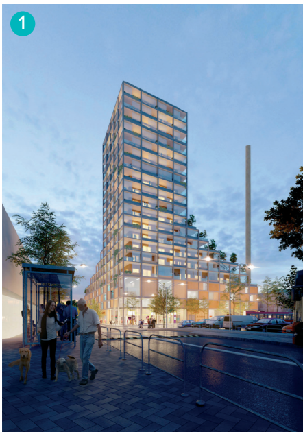
Visionsbild på hur ett höghus med bostäder, handel och parkeringsgarage kan se ut. Bild: Kirsh + Dereka Arkitekter.