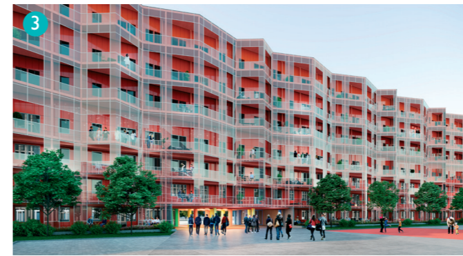
Visionsbild över hur Röda längan kan komma att se ut. Bild: Wingårdh Arkitektkontor.

Lokaler för butiker, restauranger och företag planeras i bottenplanet vilket skapar en levande gatumiljö. Byggstart för parkeringshuset med handel och bostäder, är planerad till våren 2020 med inflyttning sommaren 2022. Just nu pågår arbetet med detaljplanen. Läs mer på nacka.se/knutpunkten