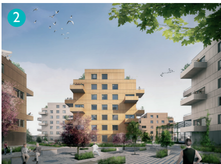
Visionsbild över hur Nybackakvarterets östra del kan komma att se ut. Bild: Arkitekt DinellJohansson.