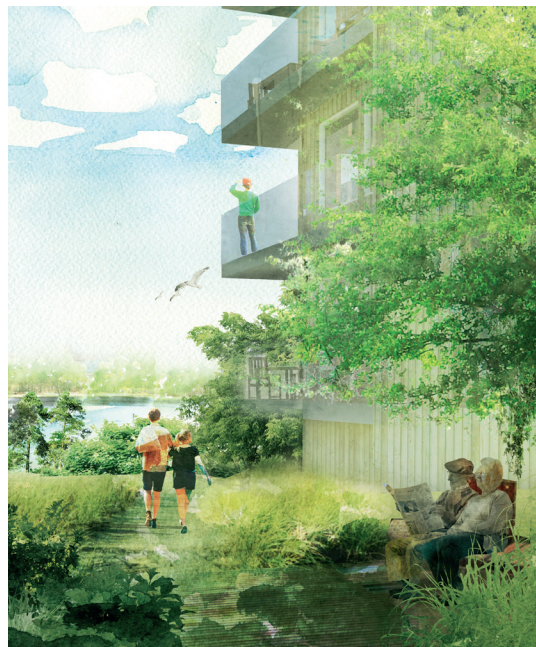
Visionsbild över hur Kraftledningsstraket kan komma att se ut. Bild: Sweco Architects.

De gamla luftburna kraftledningarna rivs och byts ut till markförlagda kablar, vilket stärker kapaciteten på elnätet och frigör mark för annat. Nu blir det möjligt att bygga bostäder och verksamheter på platser som tidigare varit kraftledningsgator. Det är Vattenfall som utför arbetet och ledningssträckan för den nya markkabeln planeras bli 3,6 kilometer. Kabeln läggs som regel i befintliga vägar. Det gör att framkomligheten på vissa gator, gång- och cykelvägar, kommer att begränsas tillfälligt. I Orminge berörs Skarpövägen, Ormingeringen och Mensättravägen av arbetet. Läs mer på nacka.se/kraftledningsstraket