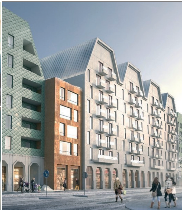
Visionsbild över nya Hantverkshuset. Illustration Brunnberg&amp;Forshed.