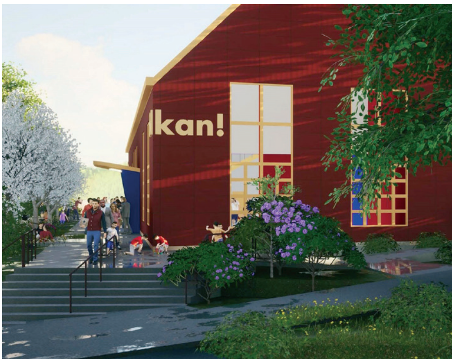
Illustration över nya Boo Folkets hus. Illustration: Arkitektur Arkitektkontor AB.