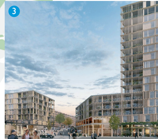
3 Visionsbild över hur nytt kvarter invid Ormingehus kan gestaltas. Illustration: White arkitekter.