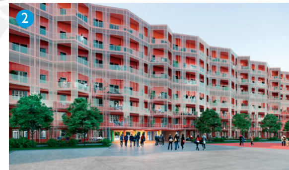
2 Visionsbild över hur Röda längan kan komma att se ut. Bild: Wingårdh Arkitektkontor.