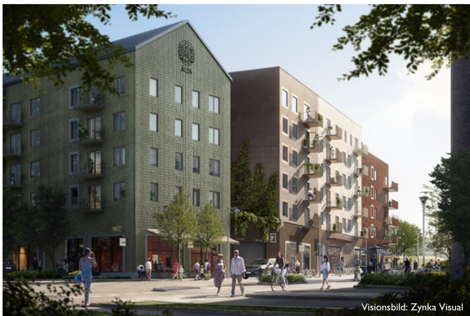
Visionsbild: Zynka Visual